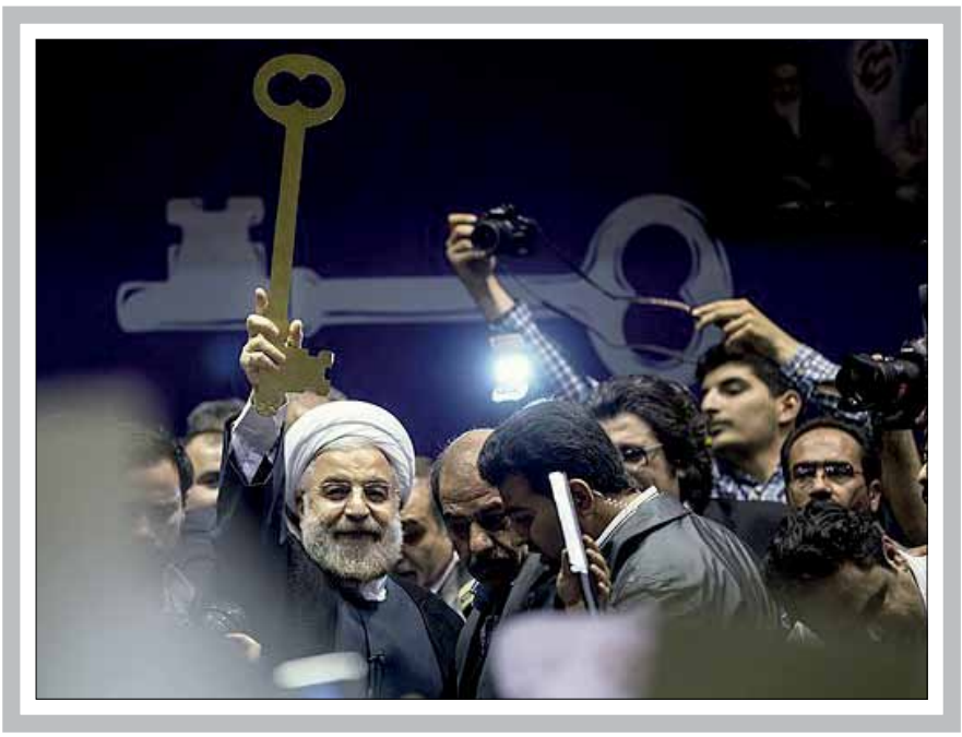
* آربین افخمی

«این بود؟ این بود؟ سندش کوی؟ من همانی را گفتم که قبلا به آن اشاره کرده‌ام. گفتم اگر می‌خواهید این‌ها را با یک‌دیگر بباورید و بعد گازانبری این‌ها را محاصره کنید، برایشان پرونده درست کنید، این کار را نکنید، اما اگر می‌خواهید آزاد بگذارید بحث دیگری است.» این شاه بیت سخنان روحانی در مناظره انتخاباتی سال ۹۲ خطاب به محمدباقر قالیباف بود. درست دو سال و هفت روز پیش، زمانی که شهردار تهران قصد داشت با یک حمله سیاسی اتفاقات سال ۸۲ و برگزاری مراسم سالگرد حمله به کوی دانشگاه را یادآوری و روحانی را در زمینه سیاست داخلی و برخورد‌های امنیتی زمین گیر کند اما «سدمحله گازانبری» روحانی نه تنها تمام رشته‌های قالیباف را پنبه کرد بلکه یکی از عوامل اصلی فرار گرفتن کلید پاستور در دستان شیخ دیپلمات شد. به گزارش ایستا بیست دوم فروردین ۹۲ حسین روحانی فعالیت‌های خود را برای حضور در انتخابات ریاست جمهوری یازدهم آغاز کرد. نجات اقتصاد،احیای اخلاق و تعامل با جهان از اصلی‌ترین مباحث مطرح شده توسط روحانی بود. همان زمانی که خیلی‌ها بر سر آمدن یا نیامدن اکبر هاشمی رفسنجانی به صحنه انتخابات تردید داشتند.