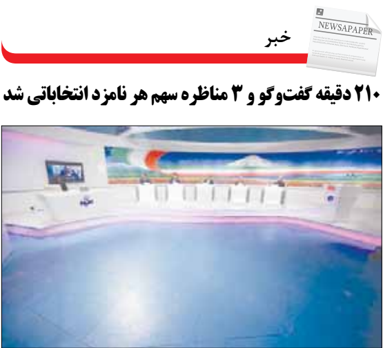
انتخابات ریاست جمهوری در تلویزیون را اعلام کرد.