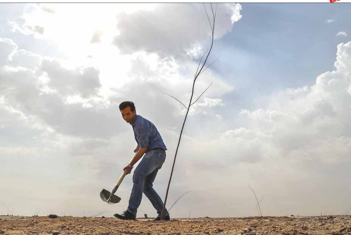
مهر امهدی پدرا مخو