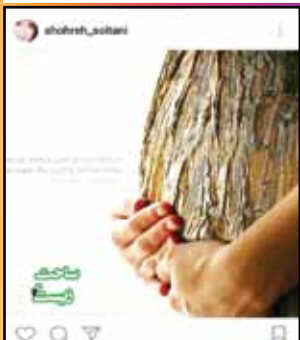
شهره سلطانی: مادر طبیعت نیاز به مراقبت و حمایت دارد

کوری: همیشه به سری کانال تو تلگرام عضو می‌شم که زبانه رو تقویت کنم در آخر وقتی هزار تا پیام جمع شده از شون لفت میدم مایکل آنجلو: یکی از بیماری‌هایی که دارم اینه که وقتی به حرف از پسورد رو اشتباه می‌زنم کلا همشو پاک می‌کنم دوباره از اول می‌زنم.