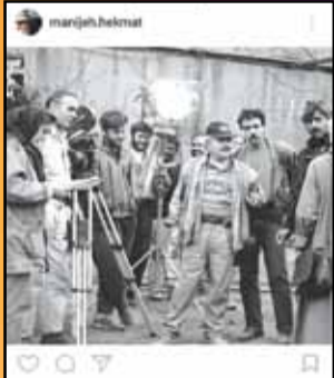
منیژه حکمت: فیلم دیوانه‌وار