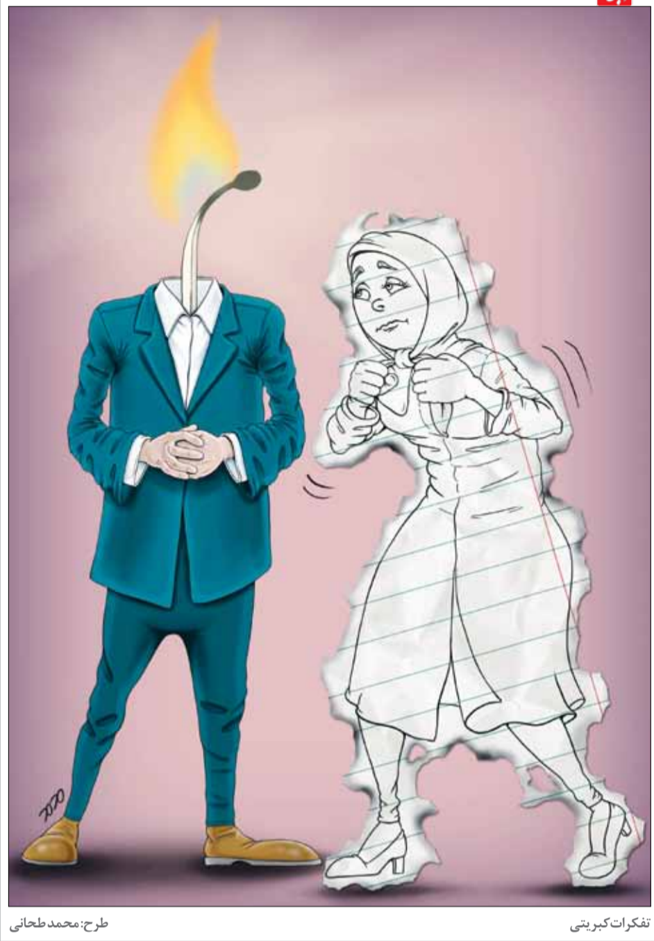
طرح: محمد طحانی

از اشتباه کردن نترسید. این امر جزئی از مراحل یادگیری به شمار می‌رود و بدانید که بدون ارتکاب اشتباه نمی‌توانید یک زبان جدید را بیاموزید. در این راستا، لازم است با دیگران وارد مکالمه بشوید و سعی کنید با افراد غریبه صحبت کنید، از آن‌ها آدرس بپرسید، غذا سفارش دهید. آن وقت از این طریق می‌توانید در موقعیت‌های متفاوت به‌راحتی ارتباط برقرار کنید. در این مسیر باید صبور باشید زیرا ممکن است کلمات مورد نیاز یادتان نیاید یا اشکال گرامری داشته باشید، اما به‌مرور قادر به برطرف کردن آن‌ها خواهید بود.