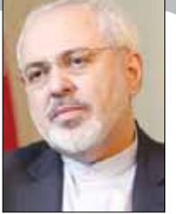
محمد رضا ستاری