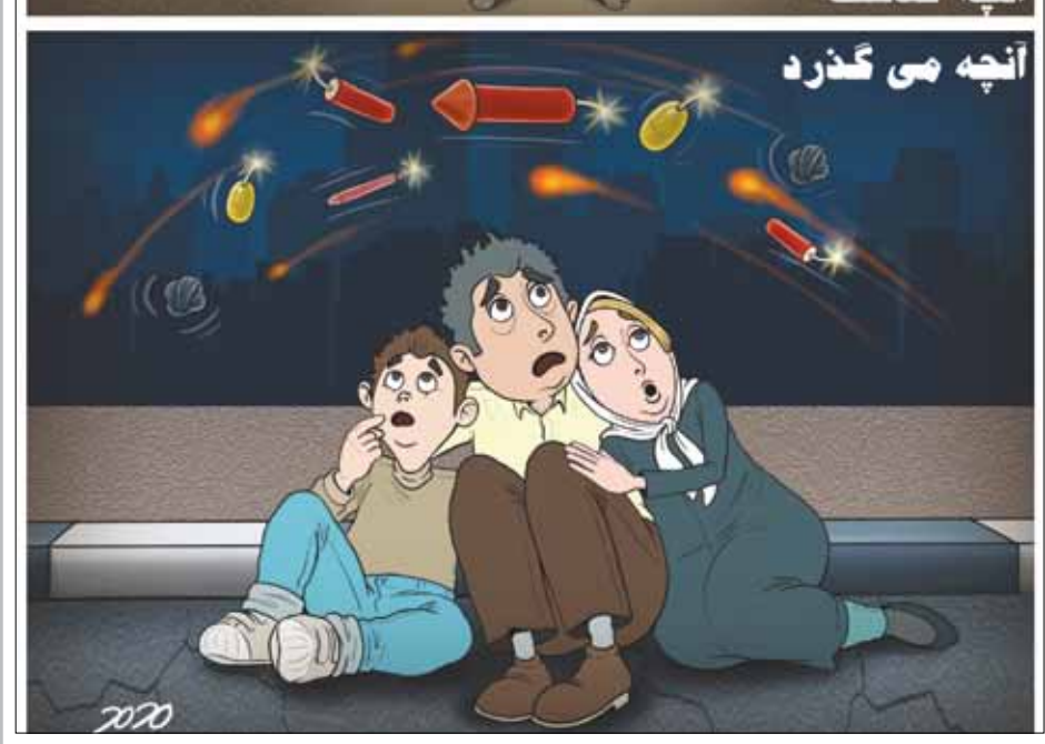
چهارشنبه سوری طرح: محمد طحانی