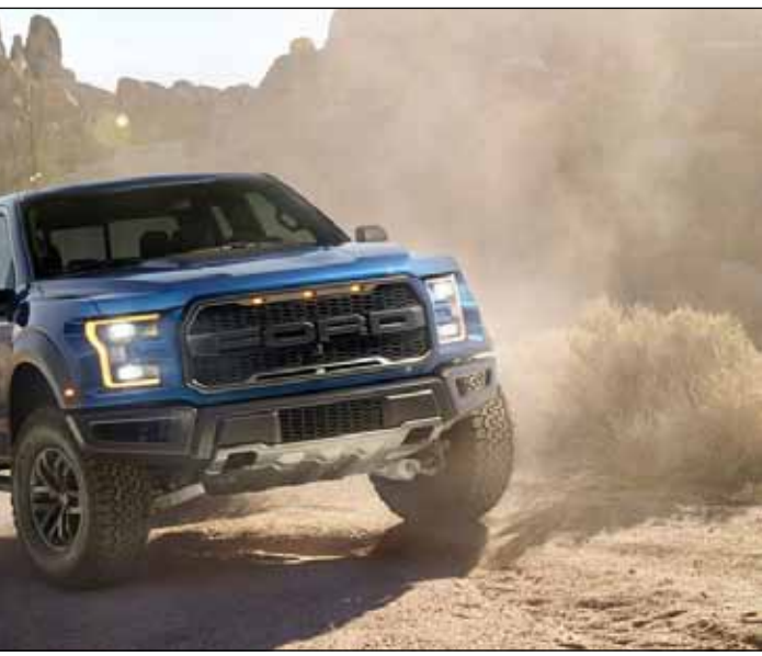
منبع: پدال (pedal.ir)