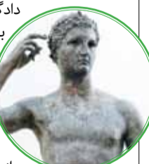
لس‌آنجلس) موظف شده است، مجسمه ۲۰۰۰ ساله را به کشور ایتالیا برگرداند.

این موزه قصد دارد از حقوق قانونی خود در برابر بازگرداندن مجسمه باستانی یونانی به نام «جوان پیروز» دفاع کند. این اثر توسط هنرمند یونانی به نام «لوئیپوس» بین ۱۰۰ تا ۳۰۰ سال قبل از میلاد مسیح ساخته شده است. مجسمه برنزی توسط یک ماهیگیر از پساو در سواحل دریای آدریاتیک در سال ۱۹۶۴ پیدا شد و چندین بار فروخته شد تا در نهایت نزدیک به ۴۰ سال قبل به موزه گنتی سپرده شد.