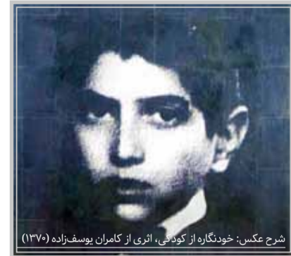
شرح عکس: خودنگاره از کودکی، اثری از کامران یوسفزاده (۱۳۷۰)

مریم ثابت قدم اصفهان* تابلویی با ابعادی بزرگ، از هنرمند ایرانی، کامران یوسفزاده با نام مستعار «وایزی کامی»، از برجسته‌ترین هنرمندان معاصر که در دهمین حراج بزرگ تهران با برآورد قیمت ۸۰۰ میلیون تا یک میلیارد و دو بیست میلیون تومان به نمایش گذاشته شده؛ پیامی فلسفی و جهان‌شمول دارد و با ارجاع به خاطرات نوستالژیک هنرمند، ابعاد درونی و الوهی شخصیت انسانی را در قالب خودنگاره مورد توجه قرار می‌دهد. چهره در این تابلو مبین ساحت نمادین روح و معصومیت نهادینه است که چنان در چرخه‌ای به سمت جهانی پرمز و راز گشوده می‌شود و از معنای درونی و هستی‌شناسانه انسان پرده برمی‌دارد. از این‌روست که «صورت» در فرهنگ نمادها به‌عنوان تجلی راز، الوهیت پنهان و همچنین انعکاسی از انرژی امپال و عواطف درونی انسان توصیف می‌شود. انسانی که از وری نگاه درون‌شناختی‌اش که گویی به فراسوی خویش می‌نگرد، بر وجوه معنوی موجودیت خویش صحنه می‌گذارد و تعریفی از خود ارائه می‌دهد که مبتنی بر ارزش‌های فراشخصیتی اوست.