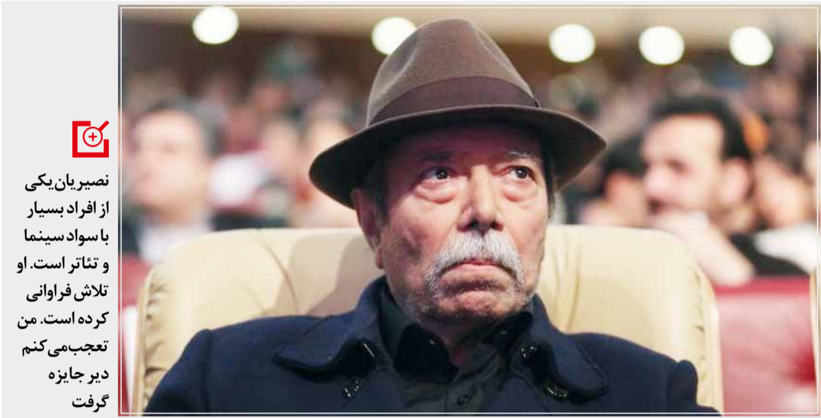
نصیریان یکی از افراد بسیار با سواد سینما و تئاتر است. او تلاش فراوانی کرده است. من تعجب می‌کنم دیر جایزه گرفت

گروه هنر - سی‌وهفتمین جشنواره ملی فیلم فجر شامگاه ۲۲ بهمن به گام آخر رسید و با برپایی اختتامیه در برج میلاد، برندگان این رقابت سینمایی معرفی شدند. حضور جمشید شمايخی و علی نصیریان به عنوان پیشگسوتان سینما از نکات این برنامه بود که نصیریان برای اولین بار صاحب سیمرب بلورین شد. مهدی صباغزاده در همین رابطه به «ایبتکار» می‌گوید: «علی نصیریان باید زودتر جایزه می‌گرفت.»