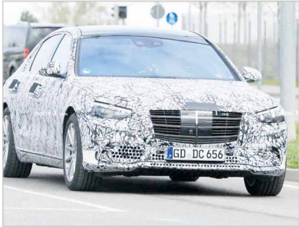
نسل جدید کلاس اس مرسدس بالاخره شکار عکاسان شد. در نگاه نخست اولین چیزی که توجه را جلب می‌کند قسمت بزرگ دستگیره‌های درها است که پوشانده شده‌اند و در ادامه نیز

با نگاه دقیق‌تر متوجه می‌شویم که یک دوربین در سمت شاگرد جلوپنجره قرار داده شده است. گوشه‌های سپر استتار نشده‌اند که نشان می‌دهد این خودرو سفیدرنگ بوده و ورودی‌های هوا قابی کروم‌رنگ دارند. موضوع جالب‌تری که در این خودرو استوار شده به چشم می‌خورد چراغ‌ها هستند، به طوری که چراغ‌های سمت راننده و کمک راننده با هم، هماهنگی ندارند؛ اگر کمی بیشتر دقت کنید متوجه می‌شوید که چراغ سمت راننده سه چراغ عمودی روشن هستند در صورتی که در سمت کمک‌راننده اینطور نیست.