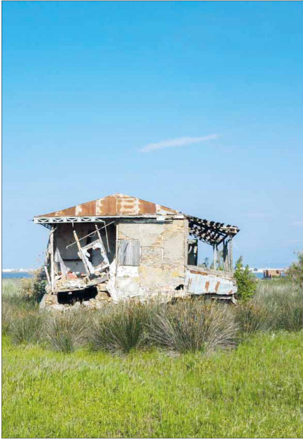
«آشوراده»، جزیره متروک

محققان می‌گویند: «نکته قابل توجه این است که حدود ۱۸ درصد از پاسخگویان، نداشتن دوستی همسر پیش از ازدواج برایشان کم‌اهمیت است و بیش از ۱۰ درصد پاسخگویان گفته‌اند: رابطه جنسی پیش از ازدواج همسرشان، برایشان کم‌اهمیت است، این نتایج با توجه به نتایج تحقیقات گذشته و فرهنگ ایرانی، نشان از تغییراتی در این معیارها دارد. همچنین نتایج نشان می‌دهد که برای سه درصد پاسخگویان، ویژگی‌های اجتماعی فرهنگی در انتخاب همسر کم‌اهمیت، ۶۱.۲ درصد متوسط و برای ۳۵.۸ درصد مهم است.» در بخش دیگری از این پژوهش آمده است: «ویژگی‌های روانی- عاطفی به ترتیب اهمیت برای پاسخگویان شامل خوش خلق بودن، اعتمادبه‌نفس داشتن، خوش معاشرت بودن، آرام بودن و وجود عشق و علاقه قبل از ازدواج است. لازم به ذکر است مردان بیشتر از زنان به وجود عشق و علاقه پیش از ازدواج اهمیت می‌دهند. همچنین ویژگی‌های روانی- عاطفی در انتخاب همسر برای ۹۰.۸ درصد پاسخگویان کم‌اهمیت، برای ۲۳.۳ درصد در حد متوسط و برای ۷۵.۹ درصد مهم بوده است.» بنا بر پژوهش‌های فولادیان و همکارانش ویژگی‌های مذهبی به ترتیب اهمیت در نظر پاسخگویان شامل مصرف نکردن مشروبات الکلی، وفاداری به همسر، اختصاص دادن زیبایی برای همسر / با غیرت بودن، نمازخواندن و روزگرفتن، اعتقاد به ضرورت حجاب داشتن و اهل تلاوت قرآن بودن است. ویژگی‌های مذهبی در انتخاب همسر برای ۳۰.۵ درصد پاسخگویان کم‌اهمیت، برای بیش از ۲۴.۲ درصد دارای اهمیت متوسط و برای ۷۲.۳ درصد مهم است.