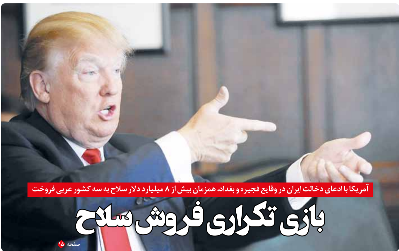
آمریکا با ادعای دخالت ایران در وقایع فجیره و بغداد، همزمان بیش از ۸ میلیارد دلار سلاح به سه کشور عربی فروخت