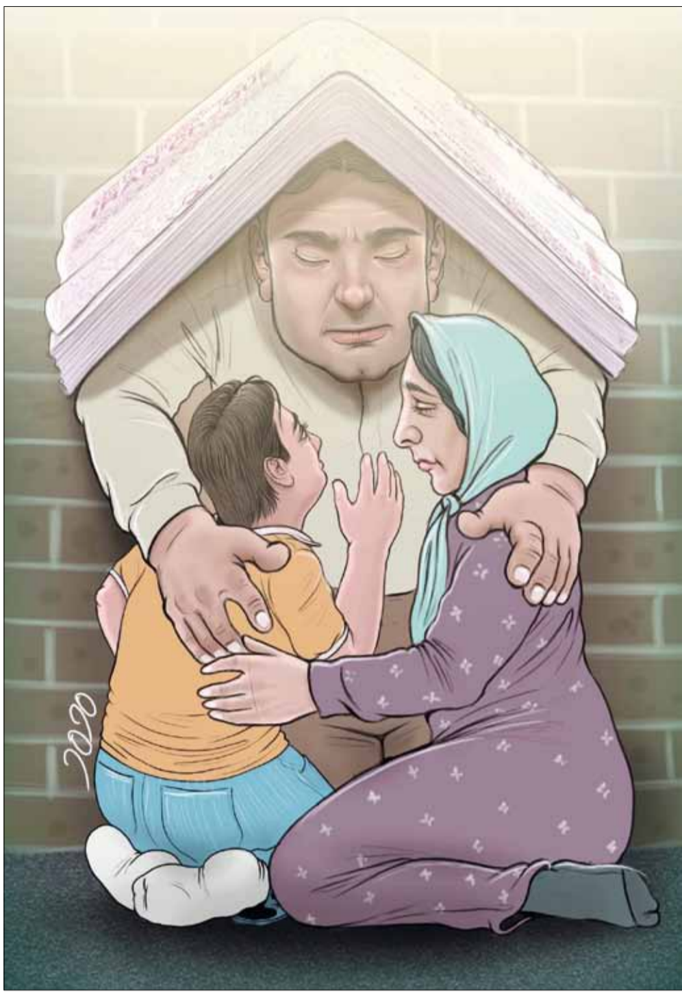
طرح: محمد طحانی