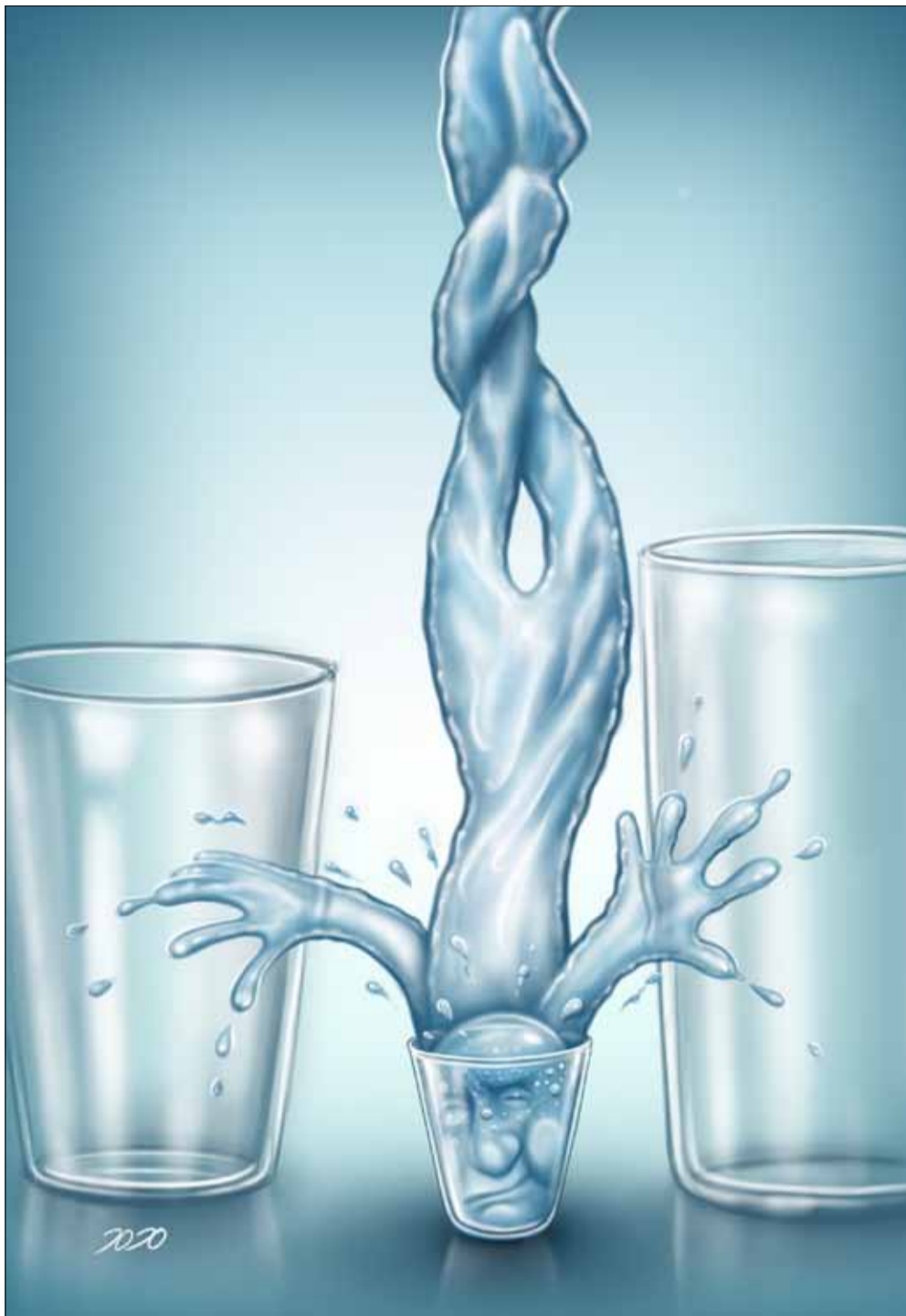
طرح: محمد طحانی