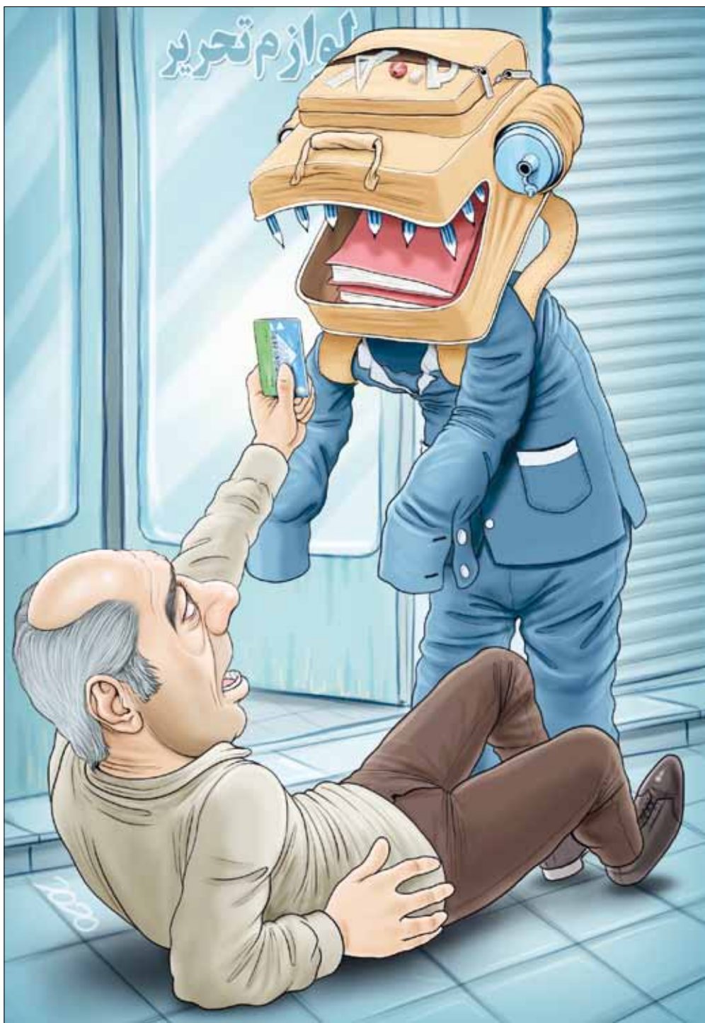
طرح: محمد طحانی