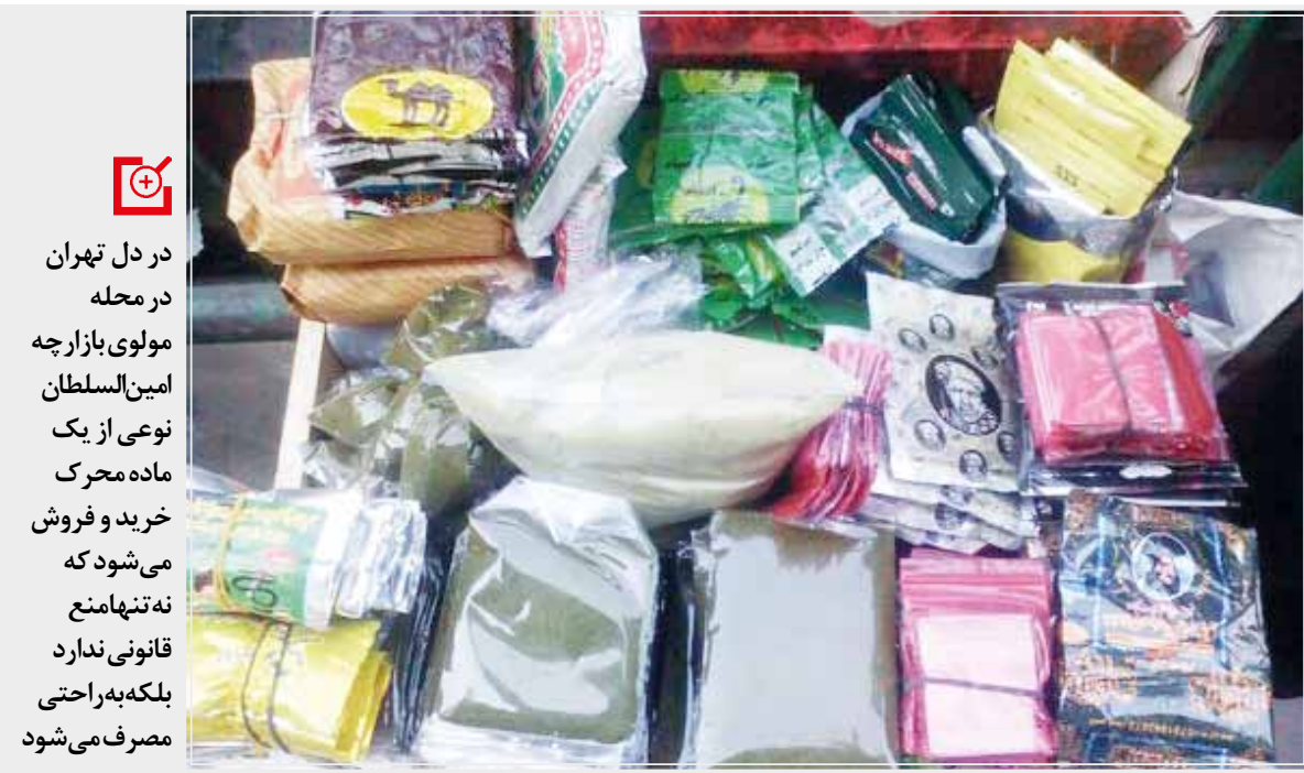
در دل تهران در محله مولوی بازارچه امین‌السلطان نوعی از یک ماده محرک خرید و فروش می‌شود که نه تنها منع قانونی ندارد بلکه به راحتی مصرف می‌شود

تولید، جابه‌جایی، فروش، خرید و استعمال مواد مخدر سنتی و صنعتی در کشورمان ممنوع است و براساس قانون با تمامی افرادی که نقشی در فعالیت این مواد داشته باشند برخورد انتظامی و قضایی خواهد شد، اما در دل تهران در محله مولوی بازارچه امین‌السلطان نوعی از یک ماده محرک خرید و فروش می‌شود که نه تنها منع قانونی ندارد، بلکه به راحتی در ملاعام نیز افراد معتاد به این مواد می‌توانند آن را مصرف کنند.