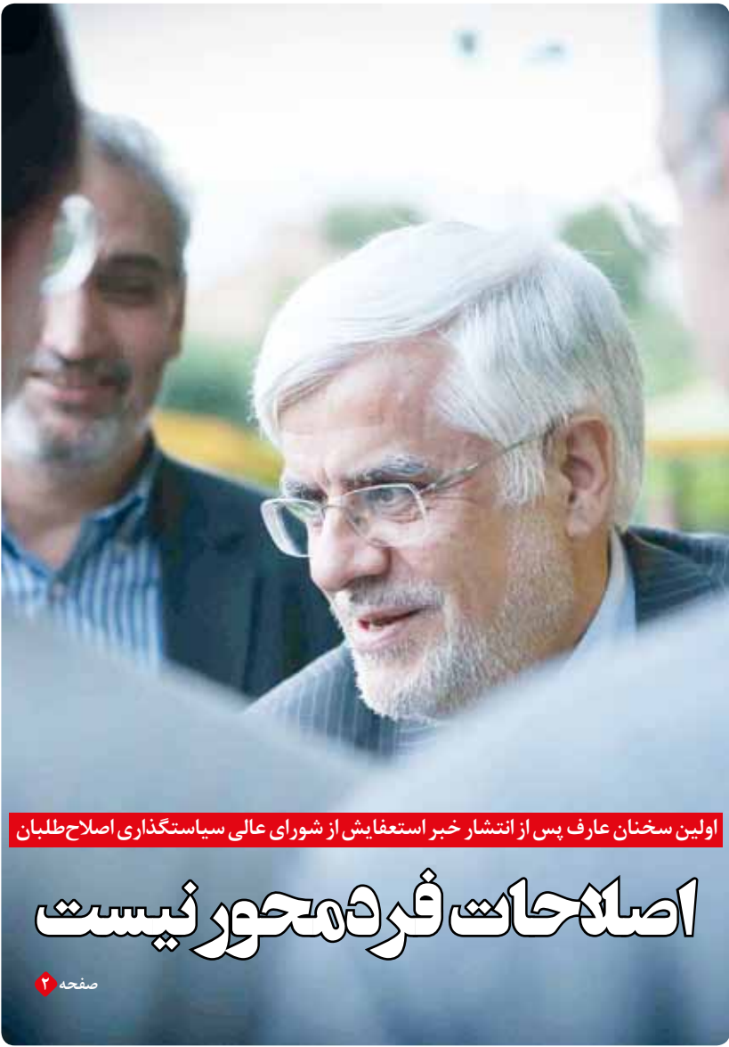
اولین سخنان عارف پس از انتشار خبر استعفایش از شورای عالی سیاستگذاری اصلاح‌طلبان