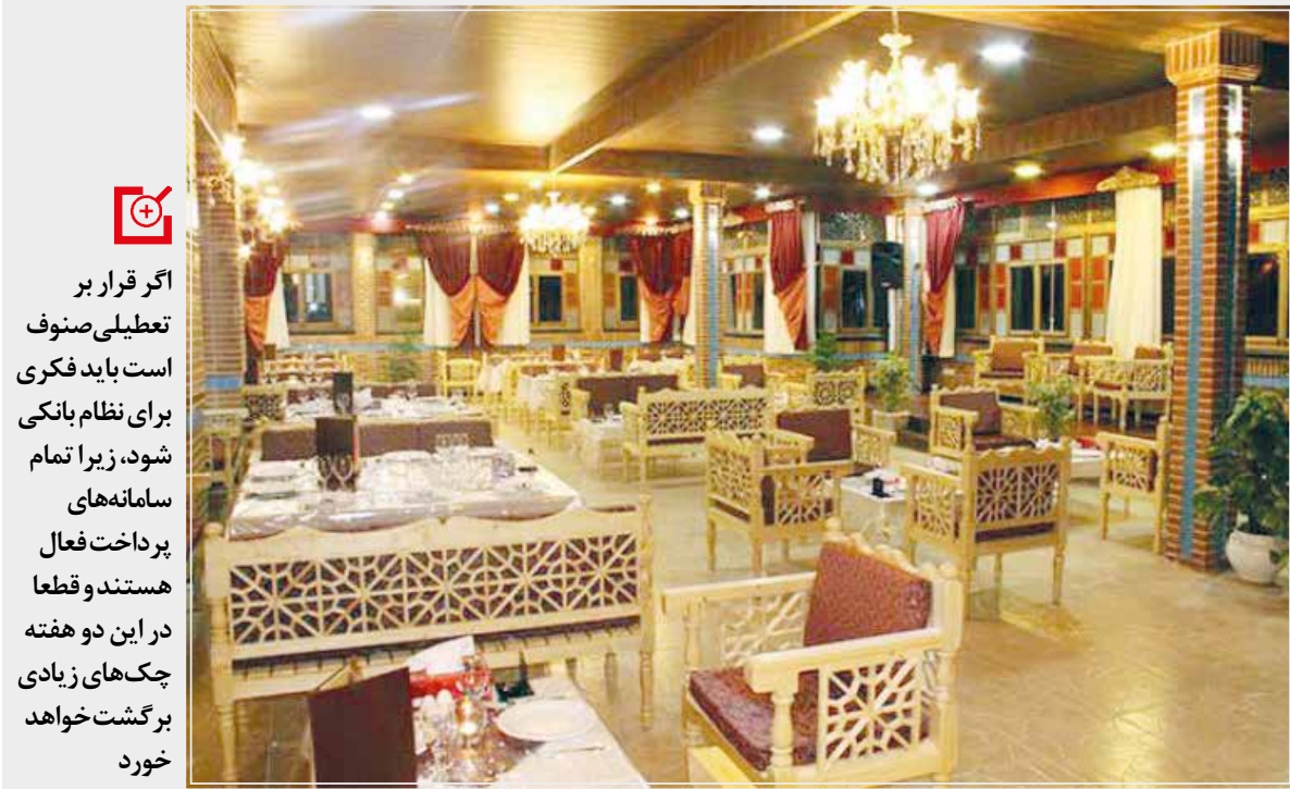
این مساله وجود دارد که برای قطع زنجیره کرونا در کشور باید همه اقشار و گروه‌های جامعه با همدلی به میدان مقابل با کرونا بروند هرچند اگر از ابتدا مردم خودشان به موضوع کنترل و رعایت پروتکل‌های بهداشتی بیشتر اهمیت می‌دادند امروز موضوع تعطیلی و محدودیت‌ها در کار نبود.

در حالی که تهران و شهرهای قرمز به تعطیلی دست‌کم دو هفته‌ای رفتند، اصناف از کم توجهی به منافع خود در این تعطیلی گلیه دارند، زیرا هیچ وعده دولت در راستای حمایت از آن‌ها عملیاتی نشده است.