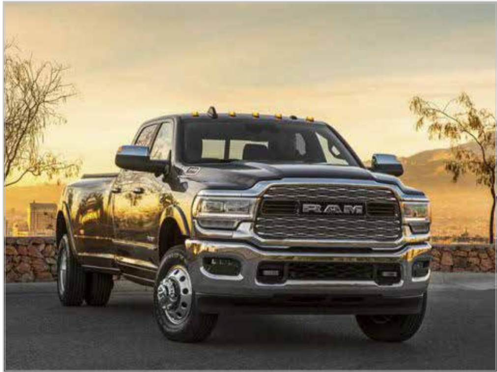
این گشتاور بیشتر باعث شده ظرفیت یدک کشی این پیکاپ سنگین به ۱۶۲۸۸ کیلوگرم برسد که بیشتر از قبل است. رم هوی دیوتی ۲۰۲۱ قوی‌تر از هر زمان دیگری شده و گشتاور ۱۴۵۸ نیوتون متری آن ۱۰۲ واحد بیشتر از مدل سال پیش است.