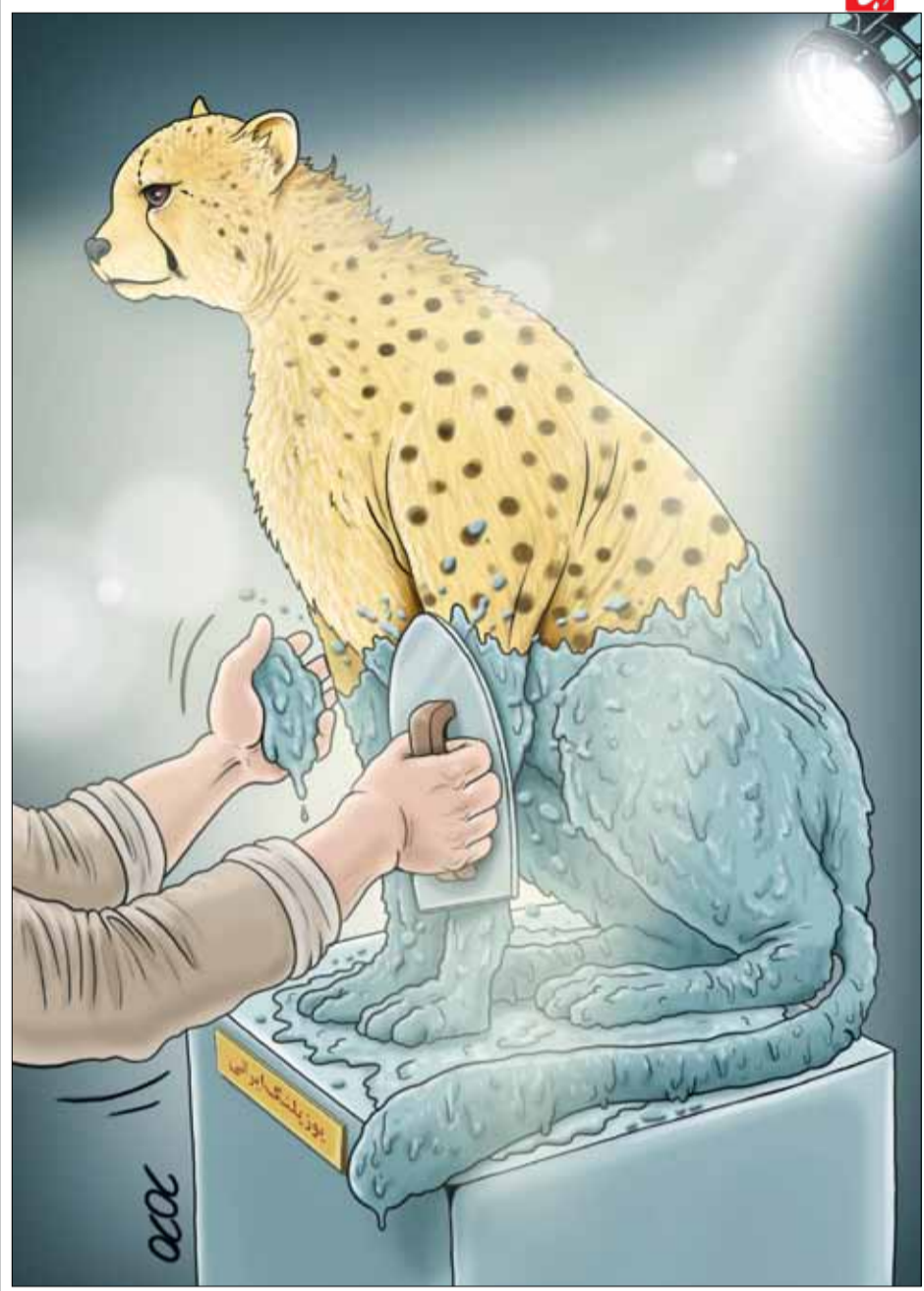
نهم شهریور روز ملی یوزپلنگ ایرانی طرح: محمد طحانی

دکتر هارتموت بلانک گفته است: «سوگیری پس‌نگر وضعیت روحی افراد افسرده را بدتر می‌کند زیرا آن‌ها رویدادهای گذشته را نیز نتایج قابل پیش‌بینی و غیرقابل انکار فرض می‌کنند، یک طرز فکر مسموم که به تقویت هر چه بیشتر احساسات منفی از قبیل ناتوانی و بیچارگی کمک می‌کند؛ حسی که افراد افسرده به وفور با آن درگیر هستند. همه انسان‌ها گاهی دچار ناامیدی یا تاسف می‌شوند که این روند