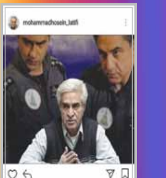
محمدحسین لطیفی: روح شاد بزرگ مرد، کارگردان کاربلد سینمای ایران