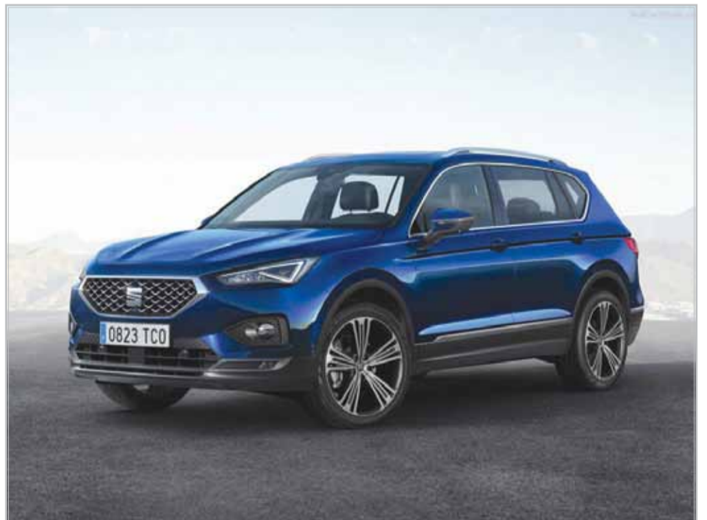
تاراگوی جدید رسیده است. این برند اسپانیایی چند روز پیش با رونمایی از تاراگو وارد بازار

شاسی بلندهای میان سایز شده است. این خودرو در جایگاهی بالاتر از آرونا و آتکا قرار می گیرد. تاراگو از زبان طراحی خاص سئات در بخش جلو بهره برده اما بدنه آن به تعدادی از محصولات فولکس واگن و اشکودا شباهت دارد. تاراگو از پلتفرم MQB-A فولکس واگن سود می برد. این معماری نه تنها فضای زیادی در کابین ایجاد می کند بلکه باعث می شود طیف وسیعی از پیشرفته های بنزینی و دیزلی با قدرت های بین ۱۵۰ تا ۱۹۰ اسب بخار را در آن نصب کرد. اگرچه شاید آینده شاسی بلند جدید سئات را ندانیم اما احتمال تولید نسخه کوپرا تاراگو وجود دارد و XTomi پیش از این موضوع اقدام به طراحی دیجیتالی چنین خودرویی کرده است. البته باید به این نکته اشاره کنیم که در این رندر بجای لوگوی کوپرا از لوگوی خود سئات استفاده شده است. تاراگوی کوپرا نشان کاملاً توجیه پذیر است زیرا سئات قبلاً سرمایه گذاری زیادی روی زیربند پرفورمنس خود کرده است. در آینده علاوه بر لئون شاهد تولید نسخه های کوپرا از آرونا، آتکا و احتمالاً یک شاسی بلند کوپه خواهیم بود. اگر تاراگو کوپرا چراغ تولید را دریافت کند قطعاً با بهبودهای ظاهری و کابین و شاسی اسپورت تر عرضه خواهد شد. نهایتاً می توان انتظار پیشرفته ای پرتوان تر را داشت که شاید نمونه به کار رفته در اشکودا کودیاک RS باشد. این خودرو از پیشرفته ۲ لیتری بای توریو با قدرت ۲۳۹ اسب بخار سود می برد. اگر سئات از پیشرفته دیزلی استفاده نکند شاید قلب تپنده ۴ سیلندر ۲ لیتری توریو بنزینی که در برخی از محصولات فولکس واگن بکار رفته یک گزینه مطرح باشد.