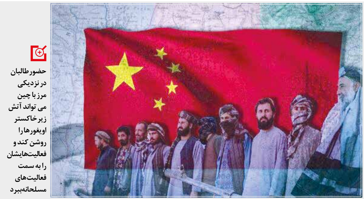
طالبان حالا مرز با چین را به تصرف درآورده و گروه‌های مسلح اویغور فضای مناسبی برای فعالیت‌های خود خواهند داشت.

ترین آنها بود. پیش از این که چنین ویدیویی منتشر شود هم عکس‌هایی منتشر می‌شد که اعضای آن را در کنار جنگجویان مسلح نشان می‌داد. اما تا قبل از آن از طرف دولت افغانستان تایید نشده بود. رسانه های افغانستان در مورد چگونگی حضور جنبش اسلامی ترکستان شرقی در این کشور نوشته اند که پس از سختگیری دولت چین بر اویغورها گروهی از آنها از مرز مشترک با افغانستان و راه های ناهموار آن به این کشور آمدند و نتوانستند با استفاده از راهتمایی طالبان دست به تشکیل گروهی مسلح بزنند. هنوز مشخص نیست که سلاح‌های بسیاری پیشرفته آنها از چه منابعی به دستشان رسیده است اما بسیاری به کشورهای غربی و حمایتشان از اویغورهایمشکوکند.