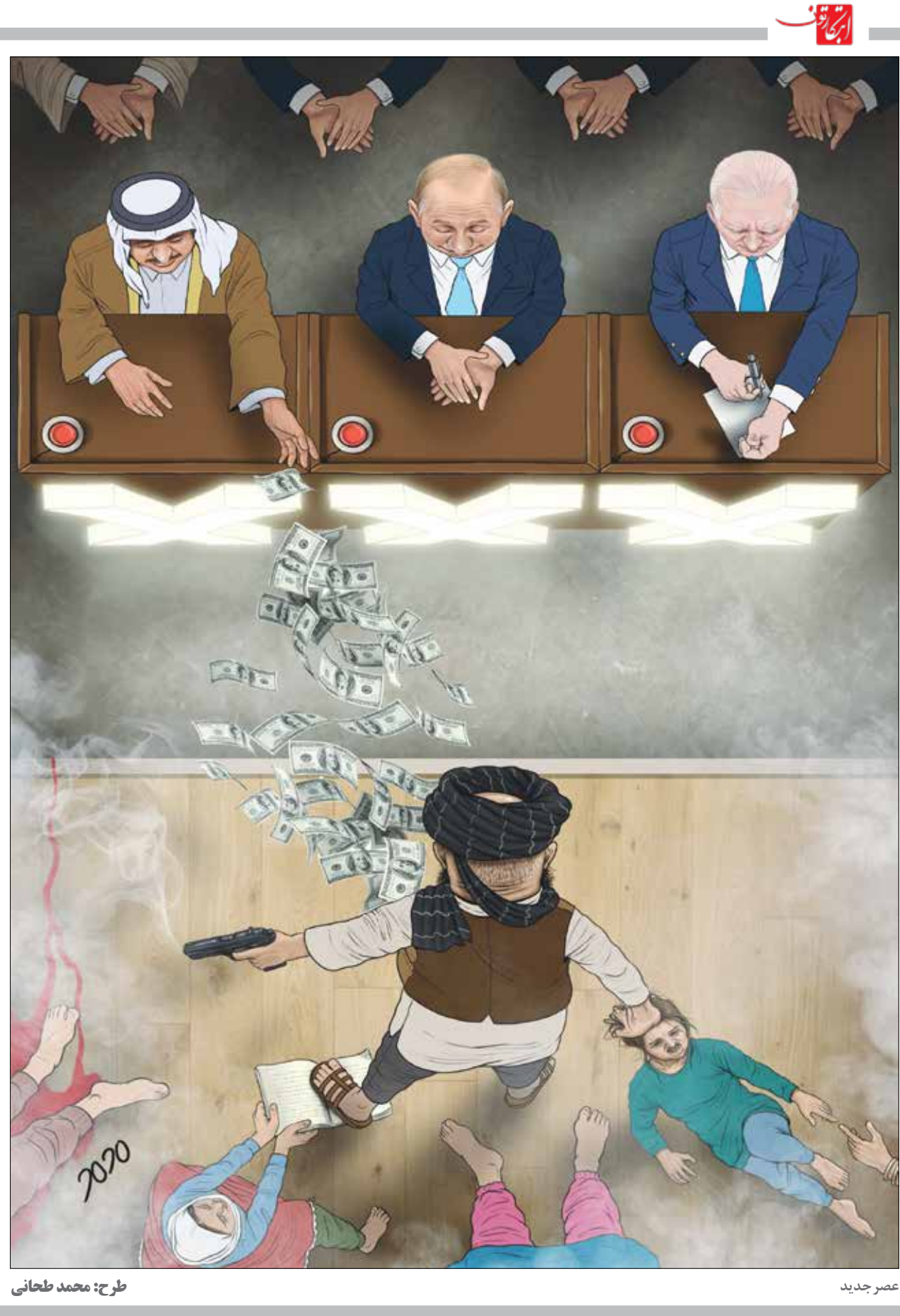
طرح: محمد طحانی

هند گوگل را به سوءاستفاده از جایگاه برتر اندروید در بازار متهم کرد کمیسیون رقابت هند در سال ۲۰۱۹ پرونده‌ای ایجاد کرد تا درباره سوءاستفاده گوگل از سلطه اندروید بر بازار گوشی‌های هوشمند تحقیق کند. این رگولاتور حالا در گزارش یافته‌های خود اعلام کرده که گوگل با سوءاستفاده از قدرت مالی بالایش باعث شده سایر تولیدکنندگان نتوانند دستگاه‌های مجهز به انشعاب‌های اندرویدی را بسازند و بفروشند. این کمیسیون می‌گوید گوگل تولیدکنندگان را در ازای دسترسی به سیستم عاملش به نصب پیش‌فرض اپلیکیشن‌های اندرویدی وادار می‌کند. این سیاست شرایط ناعادلانه‌ای را برای بسیاری از شرکت‌ها به وجود آورده و نارضاضی قوانین رقابت هند است. به‌علاوه، گفته شده که سیاست‌های پلی استور یک طرفه، میهم، نامعلوم و تبعیض‌آمیز هستند. گوگل در واکنش به این گزارش در بیانیه‌ای اعلام کرد که به دنبال روش‌هایی برای همکاری با کمیسیون رقابت هند است تا نشان دهد که اندروید چگونه توانسته به افزایش رقابت و نوآوری در بازار کمک کند. این شرکت ظاهراً تاکنون ۳۴ بار از خودش در این پرونده دفاع کرده است. سایر شرکت‌ها از جمله مایکروسافت، آمازون، اپل، سامسونگ و شیائومی هم به پرسش‌های این کمیسیون پاسخ داده‌اند. حالا هرچند نتیجه‌گیری کمیسیون رقابت این است که گوگل به‌صورت غیرقانونی به شرایط رقابت در بازار هند لطمه زده، ولی این شرکت یک بار دیگر فرصت دارد تا پیش از اعلام رای نهایی و جریمه‌های احتمالی از خودش دفاع کند. منبع: دیجیاتو