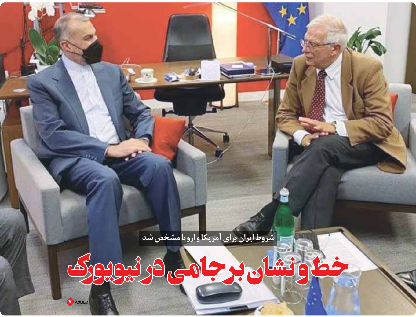
شرط ایران برای آمریکا و اروپا مشخص شد