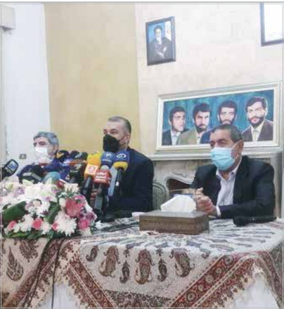
وزیر امور خارجه کشورمان با بیان اینکه دولت جدید ایران برنامه توسعه اقتصادی پایداری را به عنوان مسیر اصلی اقتصادی کشور تعیین کرده است و در این مسیر حرکت می کند گفت: ما اجرا و پیاده کردن برنامه توسعه اقتصادی کشور را به مذاکرات وین گره نخواهیم زد.

گفته می‌شود عربستان سعودی از وضعیت سیاسی در لبنان رضایت ندارد و آن را برخلاف منافع خود می‌داند.