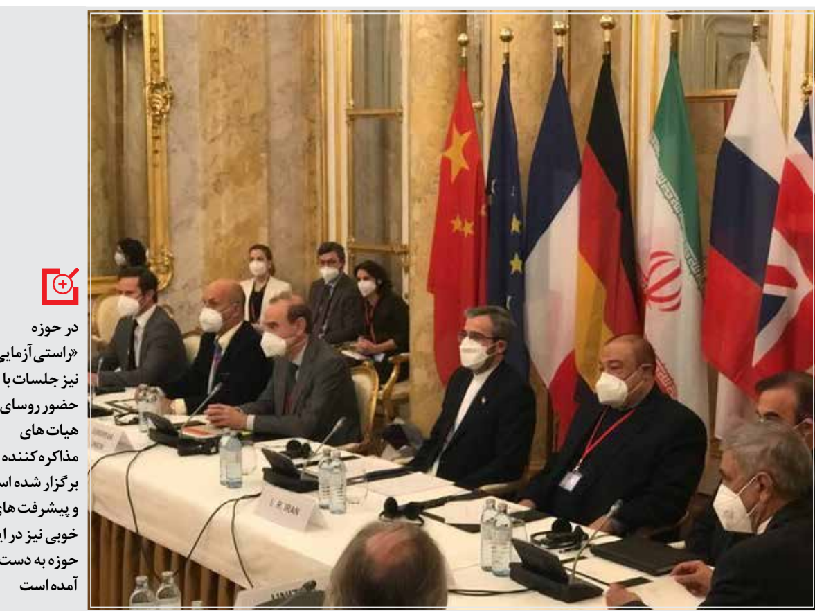
وزیر امور خارجه کشورمان روز دوشنبه در سخنانی از آمادگی ایران برای مذاکره با آمریکا در چارچوب برجام و در صورت لزوم خبر داد.

چشم‌انداز و افق مذاکرات وین به سوی توافق و بازگشت همه طرف‌ها به برجام است اما این چشم‌انداز تنها در صورتی کامل خواهد شد که آمریکا دندانش را از تحریم‌هایش علیه ایران بکشد و اجازه دهد دیپلماسی و گفت‌وگو جایگزین فشار و تهدید و تحریم شود.