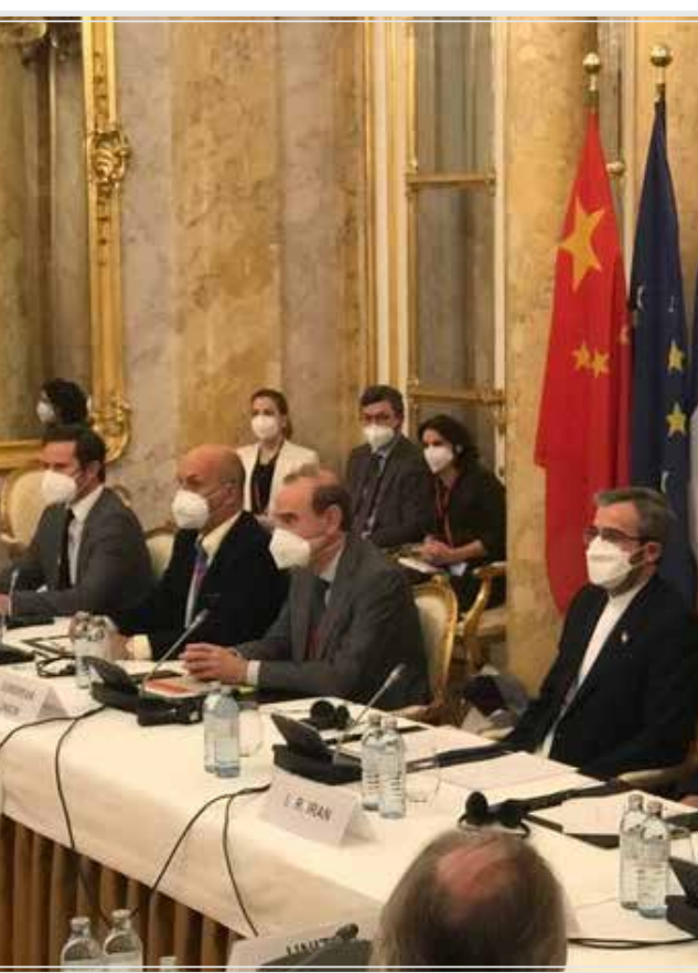
وزیر امور خارجه کشورمان روز دوشنبه در سخنانی از آمادگی ایران برای مذاکره با آمریکا در چارچوب برجام و در صورت لزوم خبر داد.

چشم‌انداز و افق مذاکرات وین به سوی توافق و بازگشت همه طرف‌ها به برجام است اما این چشم‌انداز تنها در صورتی کامل خواهد شد که آمریکا دندانش را از تحریم‌هایش علیه ایران بکشد و اجازه دهد دیپلماسی و گفت‌وگو جایگزین فشار و تهدید و تحریم شود.