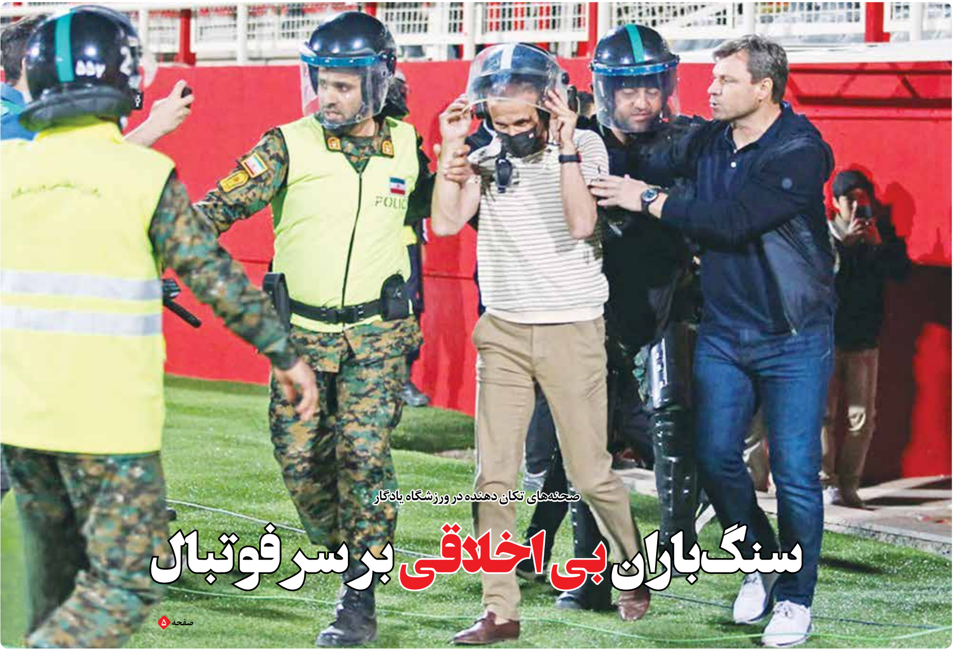
صحنه‌های تکان دهنده در ورزشگاه یادگار

اپوزیسیون همواره با هر تنش بزرگ و کوچک به میدان می‌دوند و کنتور شمارش معکوس دست می‌گیرند که نظام در سرازیری سقوط قرار گرفته؛ اگر کسی ایران را نشناسد و سوابقشان را نداند باورش می‌شود که ایان تا فتح تهران کفش از پای در نمی‌آورند. اساساً ایران به جز ماموریت ایجاد آشوب و براندازی هیچ سخن ایجابی در آستین ندارند. این جماعت به گواه هراتچه منتشر کرده‌اند، فاقد هرگونه منشور برای بهبود وضع موجود هستند. در واقع اصلاً چنین ماموریتی هم ندارند. تنها توجیهی که به آن تکیه می‌کنند فقر و کمبودهای امروز زندگی مردم است. به گمانم حتی دریافت دقیقی از مشکلات مردم هم ندارند. تنها می‌دانند که مردم معترضند و این برای موج سواری ایشان کافی است. آدمی میان این همه مصیبت و ناراحتی از مشکلات مردم، از موج سواری این میانمایگان هم غصه می‌خورد.