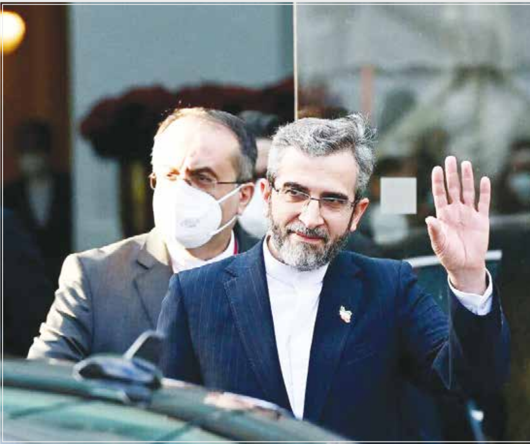
گروه بین المللی - خبرگزاری رویترز با استناد به اظهارات دو منبع مطلع، جزئیاتی را درباره حضور تیم‌های مذاکره‌کننده ایران و آمریکا در قطر برای از سرگیری مذاکرات برجامی مطرح کرد.