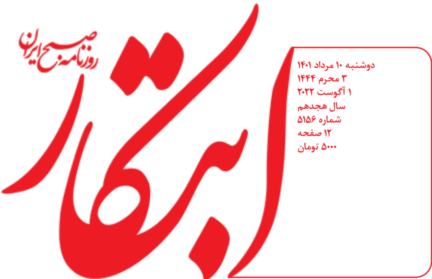
طرح: محمد طحانی