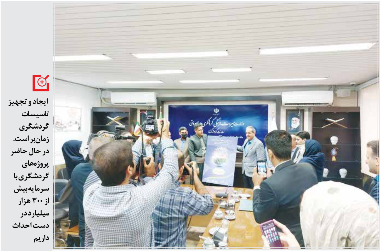
در نشست رونمایی از پوستر هفته گردشگری، از شعار روزهای این هفته نیز رونمایی و “رویش اندیشه‌های نو در گردشگری ایران” به عنوان شعار هفته گردشگری معرفی شد.

گردشگری که در هفته گردشگری گشایش می‌یابد، ادیان، گردشگری در چهار اقلیم ایران، گردشگری و پیوند اقوام ایرانی، ایران سرای اندیشمندان و مفاخر فرهنگی، ادبی، گردشگری در دسترس، گردشگری و غذاهای ایرانی، طبیعت‌گردی و… شعارهای روزهای هفته گردشگری هستند. ۱۱ مهر نیز نشست با وزیر میراث‌فرهنگی و گردشگری و تجلیل از فعالان گردشگری خواهیم داشت. نمایشگاه گردشگری اصفهان منطقه‌ای خواهد بود اما از تمام کشور در آن حضور خواهند داشت، نیز برگزار خواهد شد. او درخصوص شعار سال گردشگری ورویکرد ایران درخصوص این شعار نیز گفت: انعطاف پذیری گردشگری برای ماندگاری گردشگری و استفاده از ظرفیت‌های مغفول مانده مد نظر است. تاکنون ما بیش از ۱۷۰ جشنواره برگزار کردیم و در این هفته نیز حدود ۹۰ جشنواره داریم.