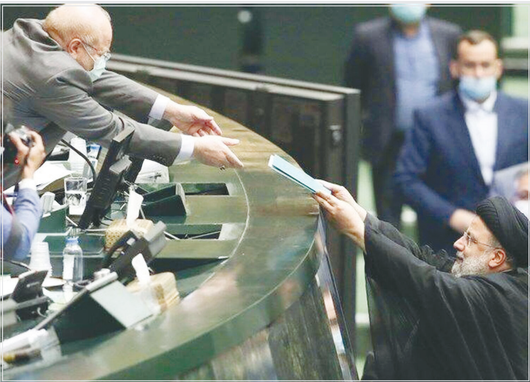
رئیس‌جمهوری با اشاره به انجام امور عقب‌مانده

گروه سیاسی - روز گذشته بعد از ۱۷ روز لایحه بودجه ۱۴۰۲ در مجلس شورای اسلامی اعلام وصول شد؛ روندی توأم با کشمکش و حرف و حدیث از این‌رو که مجلس به تقدم تعیین تکلیف برنامه توسعه معتقد بود اما دولت نظر دیگری داشت.