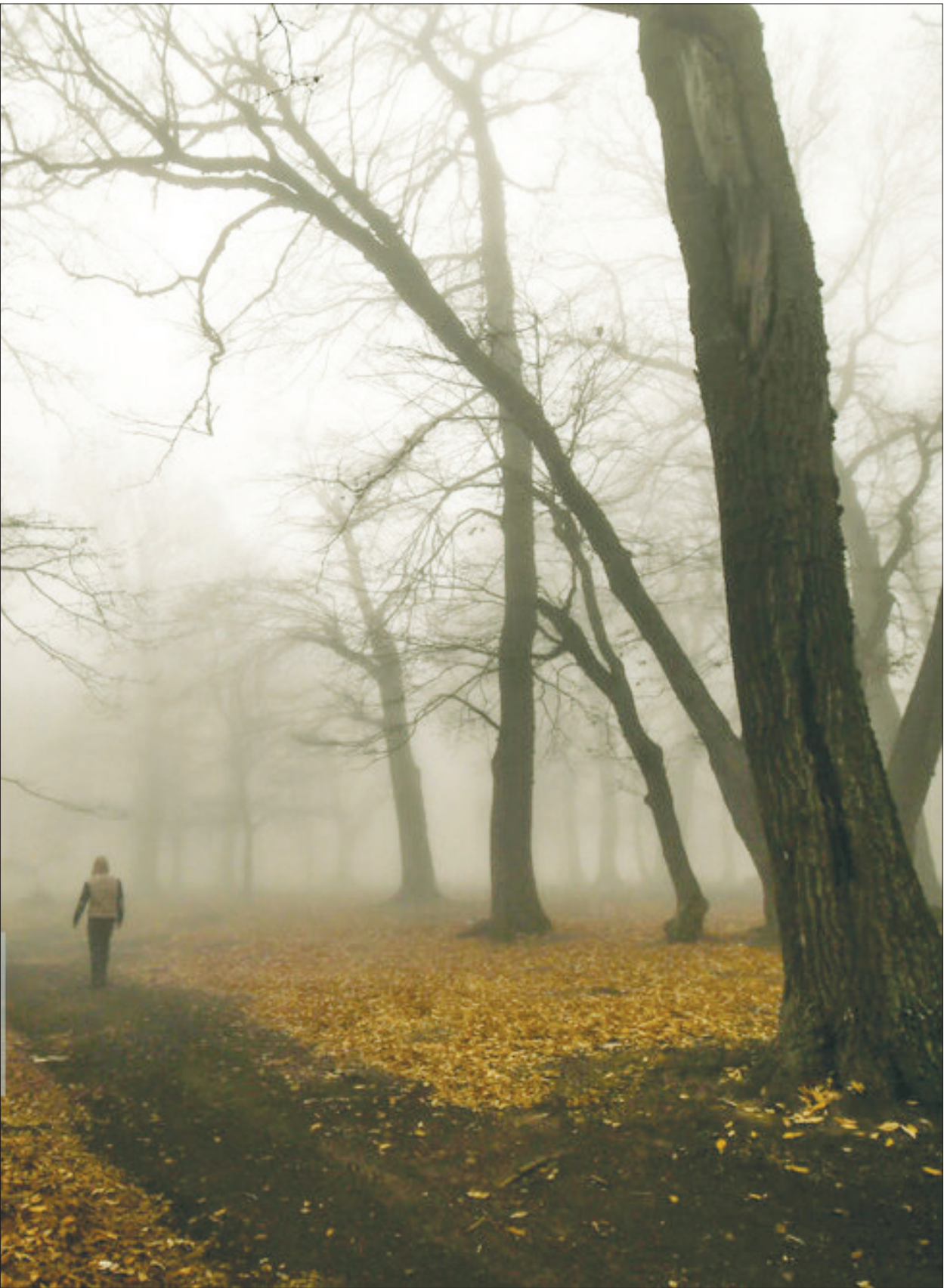
جنگل در مه