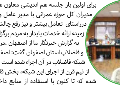
وی با بیان اینکه ۲۸ درصد فاضلاب های تصفیه شده در استان در تصفیه خانه فاضلاب شمال تصفیه

برای اولین بار جلسه هم اندیشی معاون هماهنگی امور عمرانی استاندار و مدیران کل حوزه عمرانی با مدیر عامل و معاونین آبنای استان اصفهان در راستای تعامل بیشتر و نیز رفع چالش ها با دستگاه های اجرایی، در زمینه ارائه خدمات پایدار به مردم برگزار شد. به گزارش خبرنگار ما از اصفهان، در این جلسه مدیرعامل شرکت آب و فاضلاب استان اصفهان گفت: اصفهان اولین شهر در کشور بوده که شبکه فاضلاب در آن اجراء شده است و در حال حاضر با گذشت بیش از نیم قرن از اجرای این شبکه، بخش قابل توجهی از آن دچار فرسودگی شده که تا کنون با استفاده از منابع داخلی و ظرفیت فاینانس، حدود ۱۹۳ کیلومتر از این شبکه فرسوده اصلاح شده است. وی با بیان اینکه ۲۸ درصد فاضلاب های تصفیه شده در استان در تصفیه خانه فاضلاب شمال تصفیه