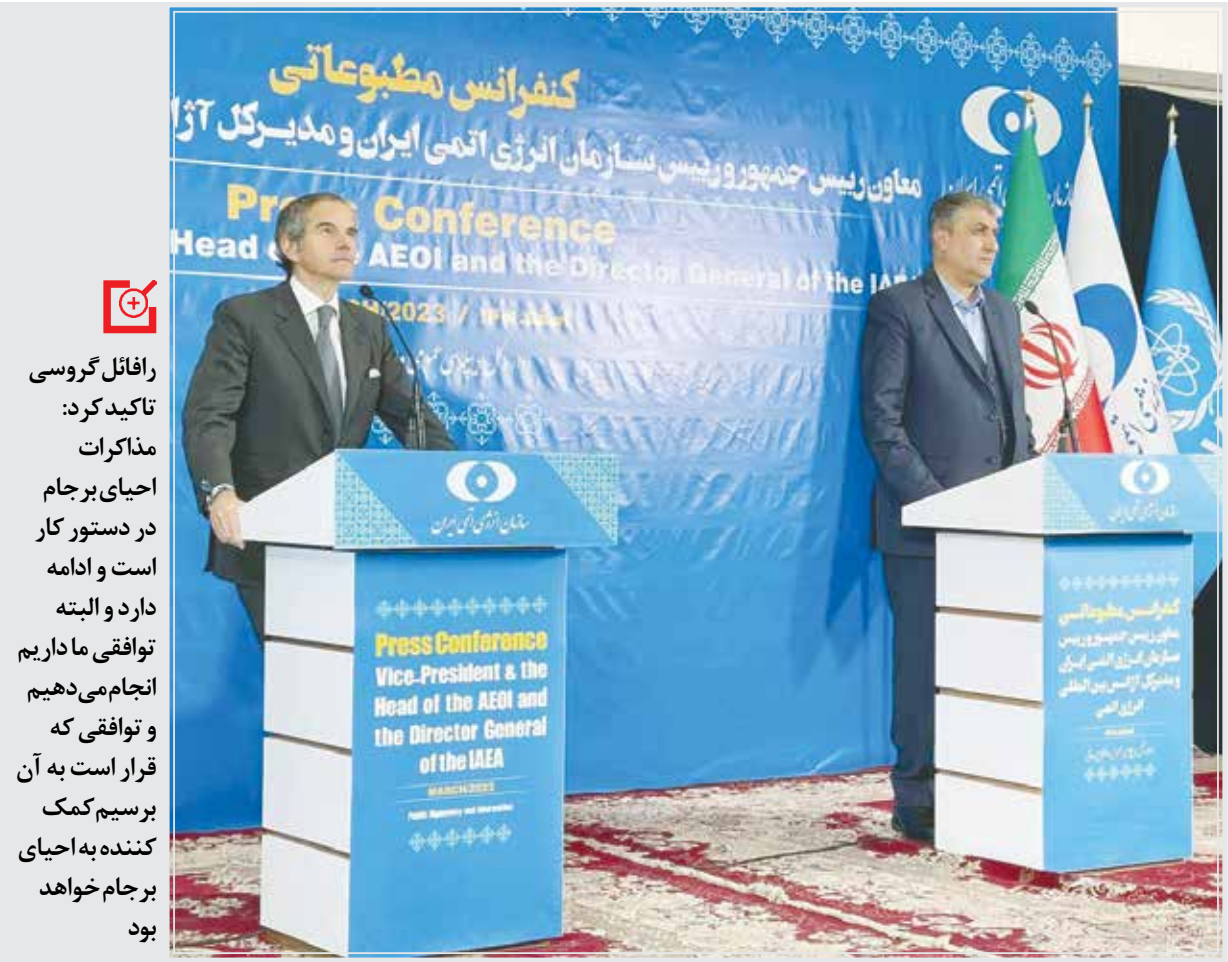
رافائل گروسی مدیرکل آژانس بین‌المللی انرژی اتمی در جریان دیدار با معاون رئیس‌جمهور و رئیس سازمان انرژی اتمی ایران، محمد اسلامی، در تهران.

گروه سیاسی - رافائل گروسی مدیرکل آژانس بین‌المللی انرژی اتمی در آستانه برگزاری نشست ماه مارس شورای حکام این آژانس روز جمعه به تهران سفر کرد تا در دیدار با مقامات کشورمان درخصوص اختلافات موجود گفت‌وگو و رایزنی کند. همانطور که پیش از این نیز اشاره شده بود، سفر گروسی به تهران از آنجا حائز اهمیت است که گزارش وی پس از سفر به تهران می‌تواند نقش مهمی در رویکرد نشست شورای حکام داشته باشد.