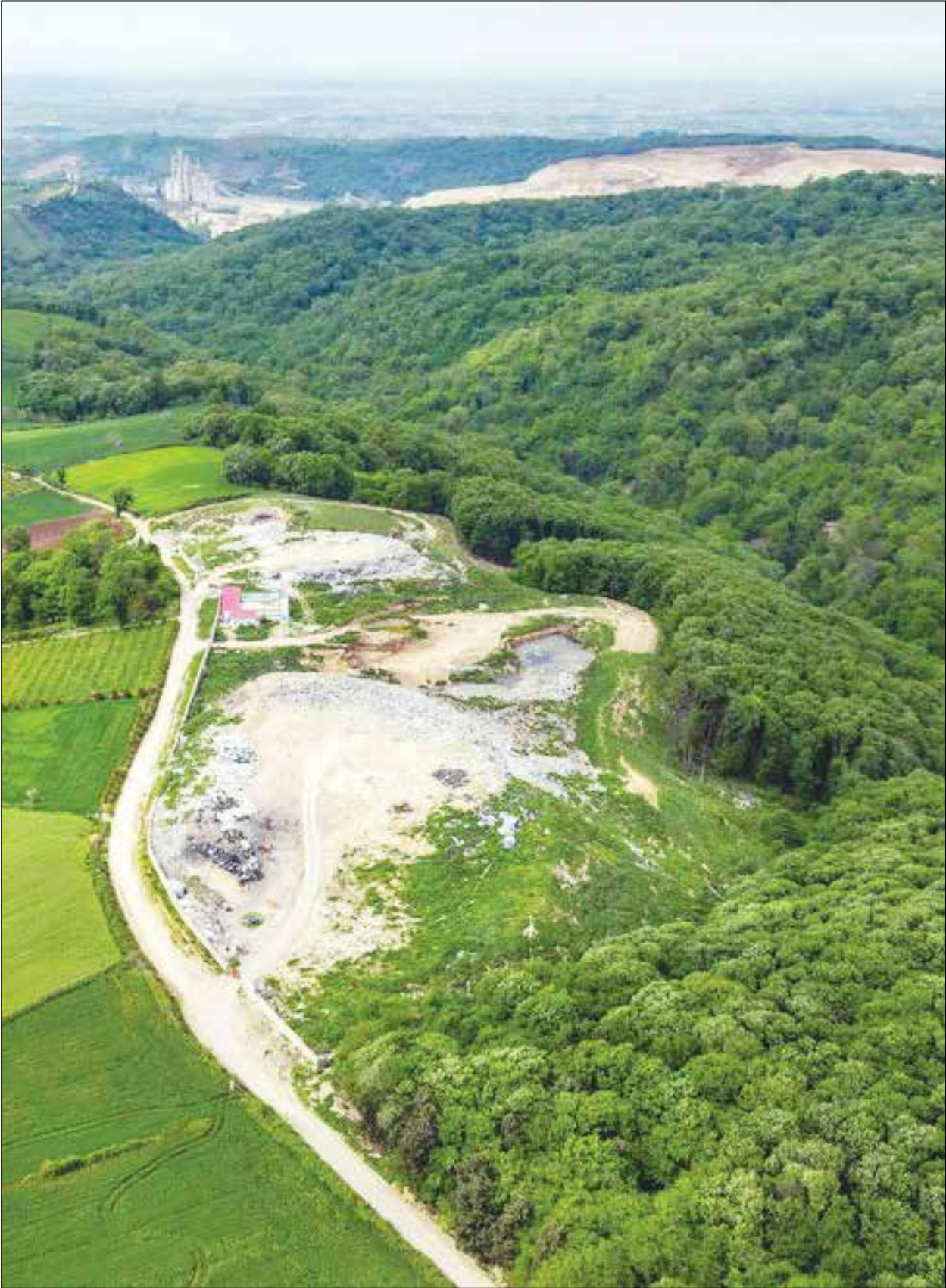
جنگل‌هایی که می‌میرند