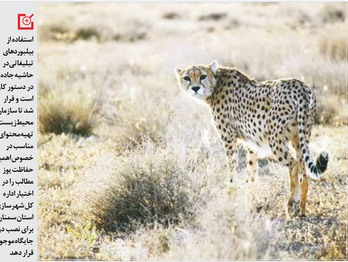
گوزن زرد ایرانی دومین در معرض خطر محیط زیست

رئیس اداره حفاظت محیط زیست ارسنجان از تولد دومین گوساله گوزن زرد ایرانی در پهنه تکثیر و پرورش این گونه حیوانی در معرض تهدید آن شهرستان، خبر داد.