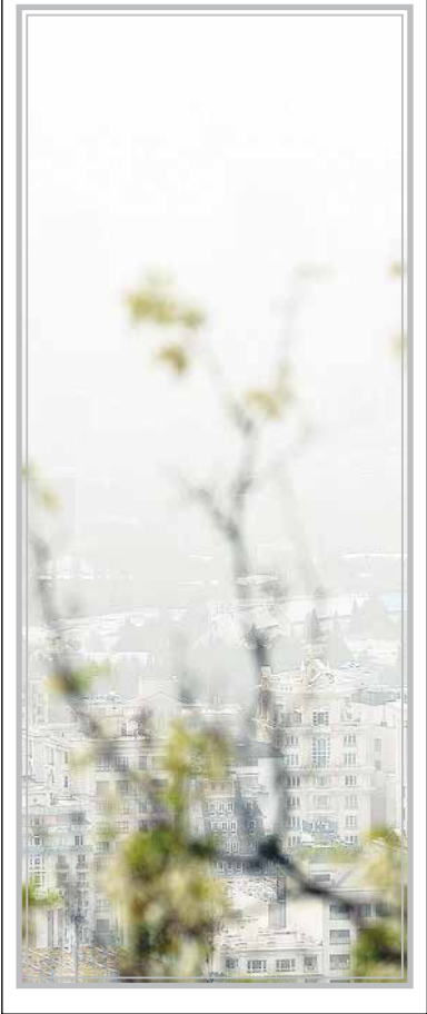
بیمارستانی در تهران

وی ادامه داد: با توجه به هشدارهای هواشناسی، از هم‌وطنان درخواست داریم تا از صعود به ارتفاعات خودداری و از حضور در کنار رودخانه‌ها پرهیز کنند.