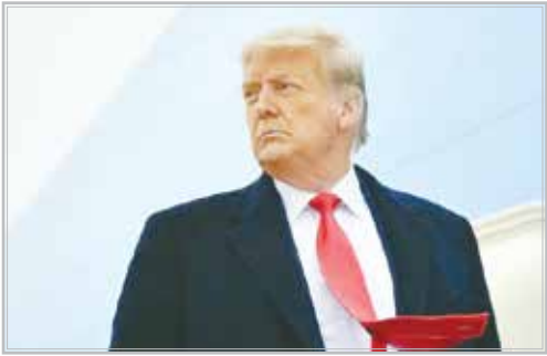
یک کارشناس مسائل بین الملل مطرح کرد

یکی کارشناس مسائل بین‌الملل، با بیان اینکه اعلام جرم علیه ترامپ یک شمشیر دو لبه برای مخالفان وی محسوب می‌شود، گفت: همانطور که ممکن است این اقدام، مناسب بودن وی برای ریاست جمهوری را زیر سوال ببرد، می‌تواند منجر به مظلوم‌نمایی وی و در نهایت افزایش محبوبیت او شود.