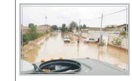
سیل در استان آذربایجان شرقی، در شمال خراسان رضوی و در استان گلستان.

این هشدار برای این‌که مردم صادر می‌شود تا بتوانند آمادگی لازم را برای مواجهه با پدیده‌های جوی داشته باشند که از حالت معمول کمی شدت بیشتری دارد. از سوی دیگر مسئولان نیز در جریان این هشدارها قرار می‌گیرند تا اگر لازم باشد تمهیداتی را ببیندیشد.