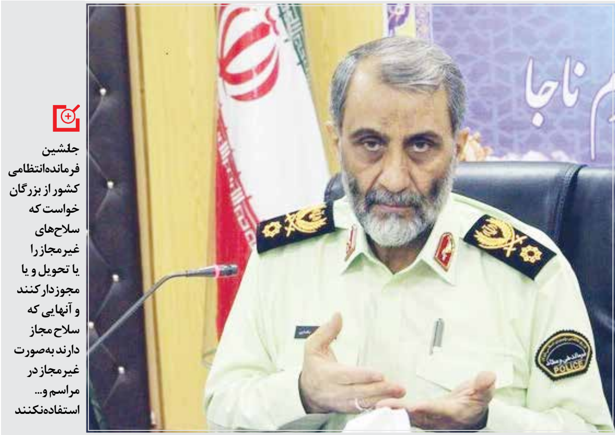
جانشین فرمانده فراجا بر ضرورت جمع آوری سلاح‌های غیرمجاز و برخورد با استفاد غیرمجاز از سلاح مجاز تاکید کرد.

خوزستان با ۲۳ هزار شهید و شهرستان شادگان که در زمان جنگ کمتر از ۱۰۰ هزار نفر جمعیت داشته بیش از ۲۴۶ شهید تقدیم نظام مقدس جمهوری اسلامی کرده‌اند.