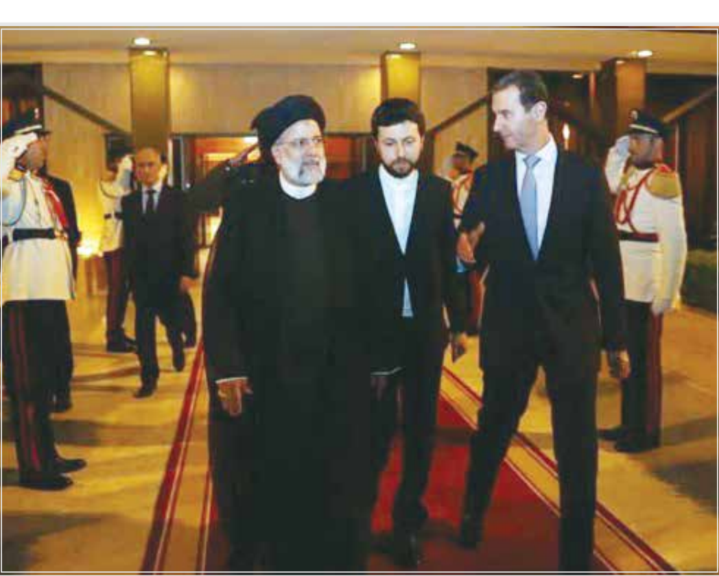
سید ابراهیم رئیسی، رئیس جمهوری کشورمان که برای سفری دو روزه به سوریه سفر کرده بود، صبح دیروز پس از مذاکرات دوباره یک‌ساعته با بنشار اسد در فرودگاه دمشق راهی ایران شد.