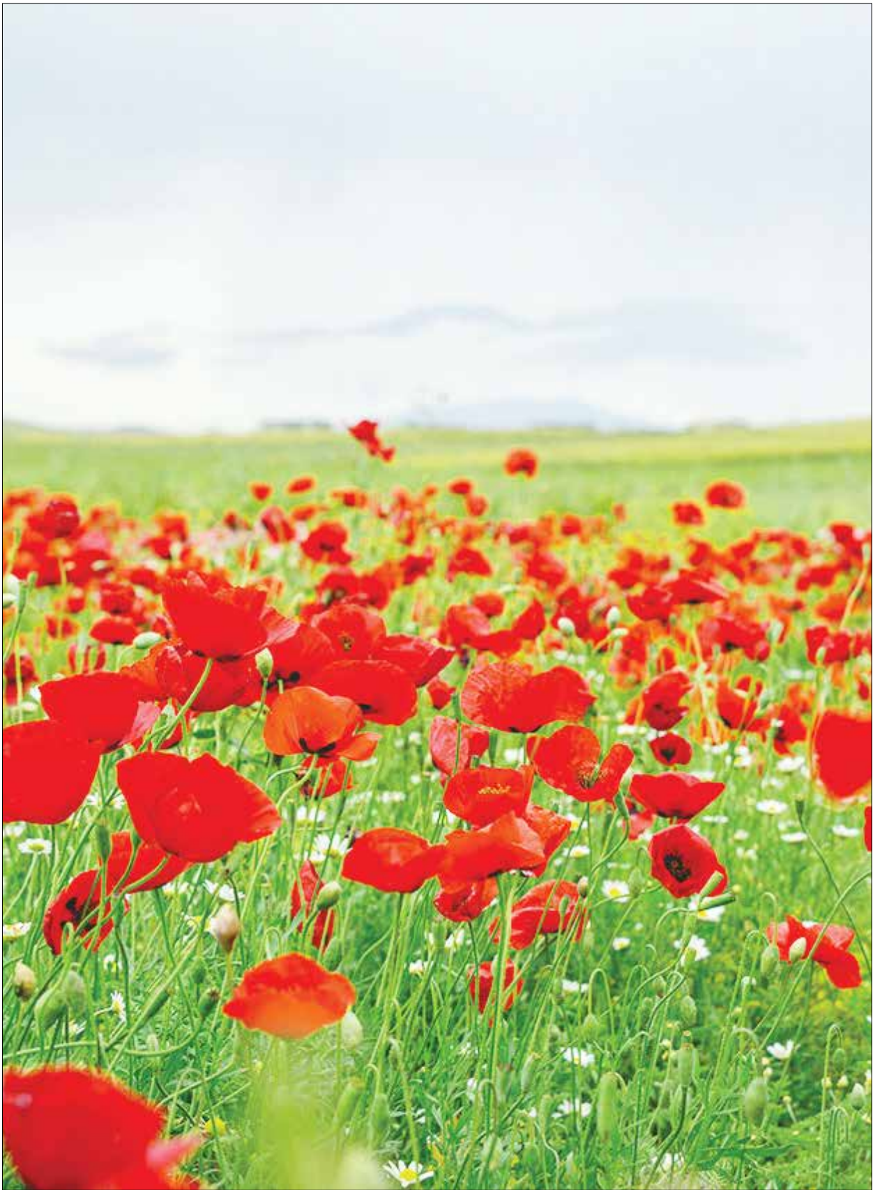
اردیبهشت لاله ها