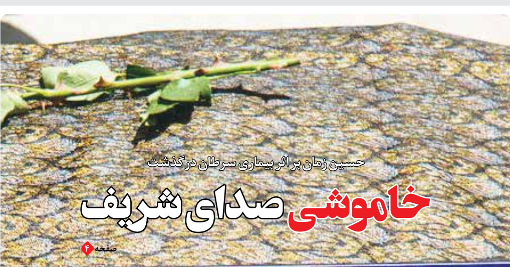
حسین رزمانی پز اثر بیماری سرطانی درگذشت