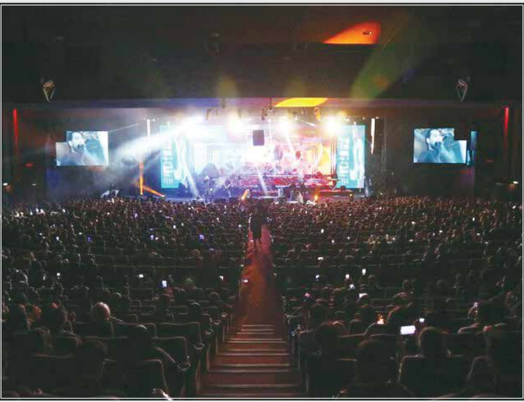
خوانندگان و هنرمندان در زیر ذره بین مخاطبان قرار گرفته و هیچ چیزی در صحنه از نظرها پنهان نمی‌ماند، ماجرا به سمتی هدایت شده که کاهش سطح کیفی برخی کنسرت‌های پاپ بیشتر از قبل به چشم می‌آید.

فقدان توجه لازم برخی خوانندگان و تهیه‌کنندگان به ارتقای کیفیت موسیقایی آثارشان در برگزاری کنسرت‌های پاپ یکی از مهم‌ترین مواردی است که طی ماه‌های اخیر می‌تواند مورد توجه قرار گیرد.