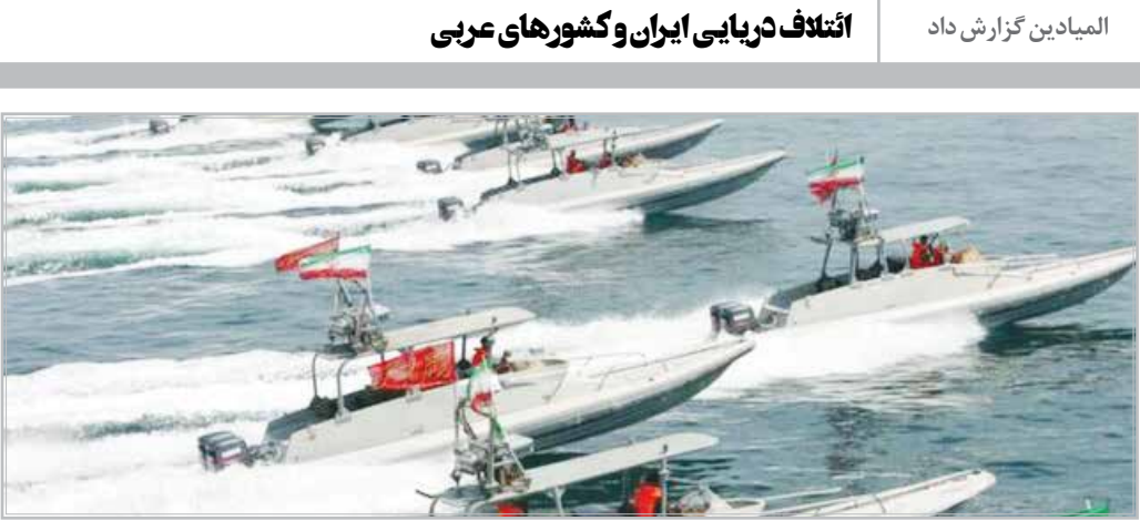
المیادین گزارش داد

این کارشناس مسائل بین‌الملل با تأکید بر اینکه یکی از کارکردهای دولت فعلی می‌تواند افزایش ظرفیت همکاری‌ها فراتر از دولت‌های قبل باشد به ویژه در حوزه اقتصادی گفت: البته تحریم‌ها مانع جدی برای فعالیت اقتصادی گسترده است اما با همه مشکلات و موانع این منطقه جای کار بسیار دارد. به علاوه اینکه اگر ایران می‌خواهد با آمریکای