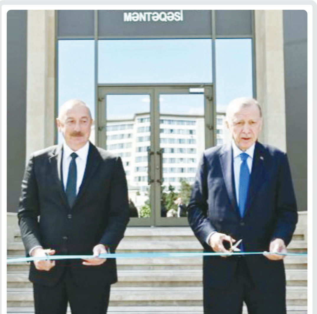
رئیس‌جمهوری ترکیه ادعاهای

صبح دیروز شورای رقابت در اطلاعیه‌ای اعلام کرد که عرضه خودرو در هر طریقی به غیر از سامانه پیکارچه فروش خودرو تخلف است و عرضه خودرو در بورس کالا باید متوقف شود؛ اما پیگیری‌های خبرنگار ایسنا حاکی از آن بود که عرضه خودروی سواری در بورس کالا متوقف نخواهد شد.