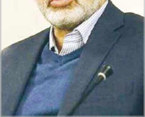
بخشنامه در دسر سراز برای وزیر کشور

محسنی‌اژهای با اشاره به مأموریت ابلاغ شده از ناحیه دولت برای بررسی و رفع مسائل و مشکلات موجود در بنادر، گمرکات و سازمان اموال تملیکی و گزارش ارائه شده وزیر دادگستری با ذکر مصایق در این خصوص، گفت: بخش قابل توجهی از ۵ الی ۶ مودی که در گزارش ارائه شده پیرامون عدم خروج کالاها، محموله‌ها و وسایل از بنادر یا گمرکات یا انبارهای اموال تملیکی، نقل شده،