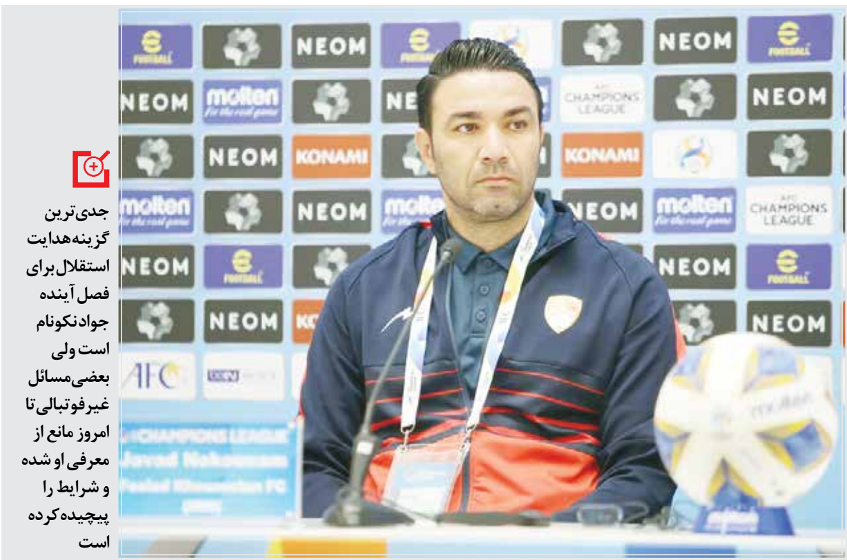
پس از جدایی ریکاردو ساپینتو هنوز سرمربی جدید استقلال مشخص نشده است.