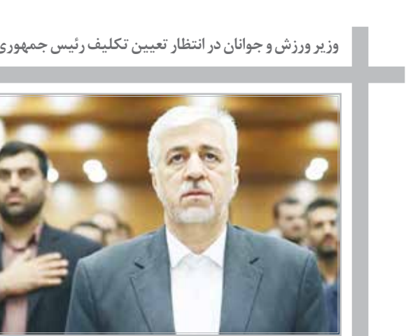
وزیر ورزش و جوانان در انتظابن تعیین تکلیف رئیس جمهوری

برخی فکر کنند با زرنگی می‌توان به اهداف و نیت خود رسید حرکت خوبی نیست و باید در برابر این اتفاقات