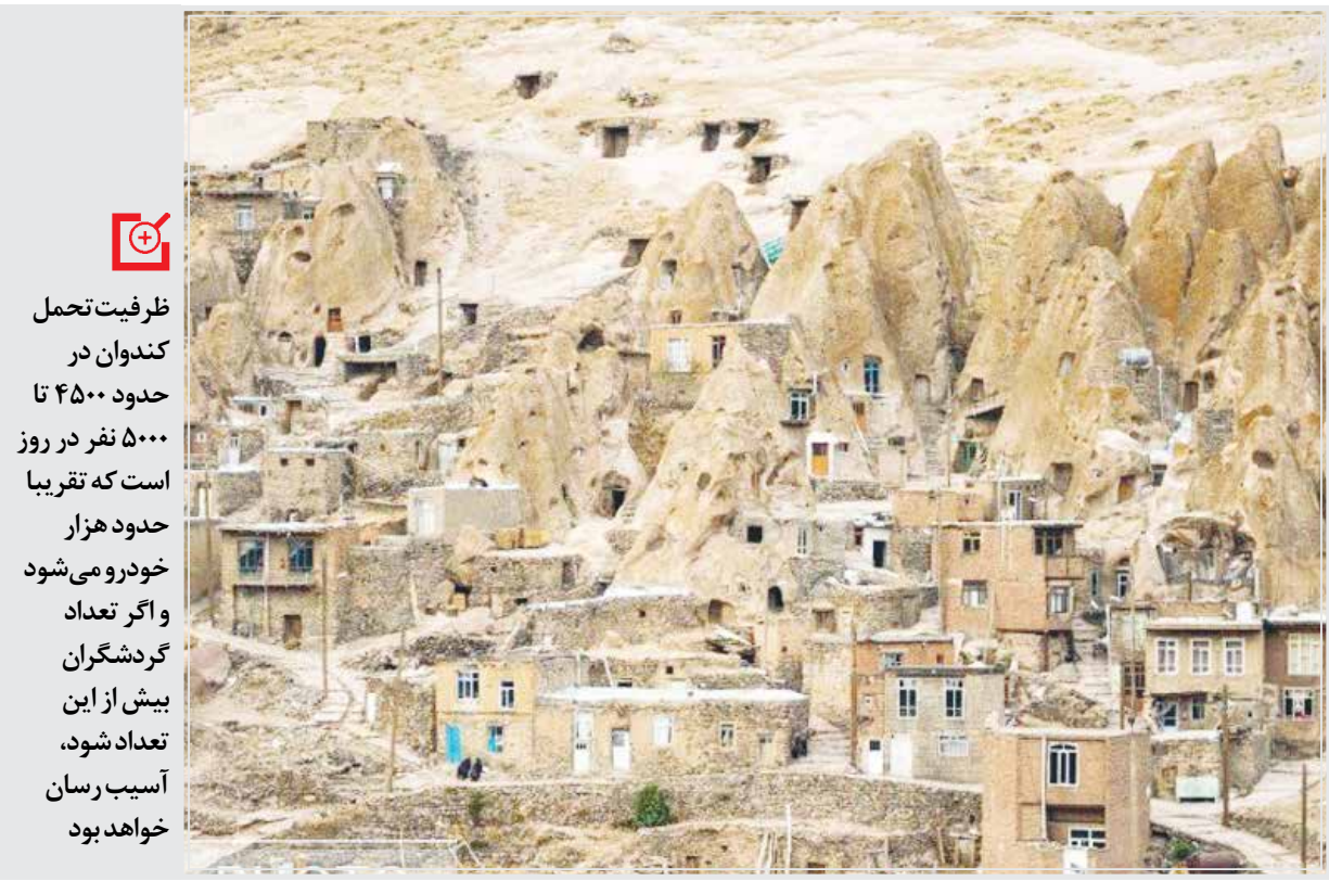
سرپرست پایگاه ملی روستای تاریخی کندوان از ادامه کف‌سازی روستا و مرمت کران‌ها خبر داد و همچنان ساخت و سازهای غیر مجاز را مانعی برای ثبت در فهرست میراث جهانی یونسکو عنوان کرد.

کندوان نیز گفت: این روزها با توجه به آنکه کندوان نسبت به سایر شهرها خنک‌تر است و هوای مطبوع‌تری دارد از این رو مورد استقبال گردشگران قرار گرفته و تقریباً می‌توان گفت هر آخر هفته ظرفیت اقامتی کاملاً پر می‌شود. البته اقامتگاه‌های بومگردی در کنار هتل بوتیک سنتی کندوان فعال است و پذیرای مسافران هستند. البته قبل از شیوع ویروس کرونا سالانه حدود یک تا یک و نیم میلیون گردشگر به کندوان سفر می‌کردند که در دوران کرونا تا حدودی کاهش یافت. امسال با توجه به حضور گردشگران تقریباً به تعداد گردشگران گذشته می‌رسیم و آخر هفته‌ها به قول معروف جای سوزن انداختن نیست.