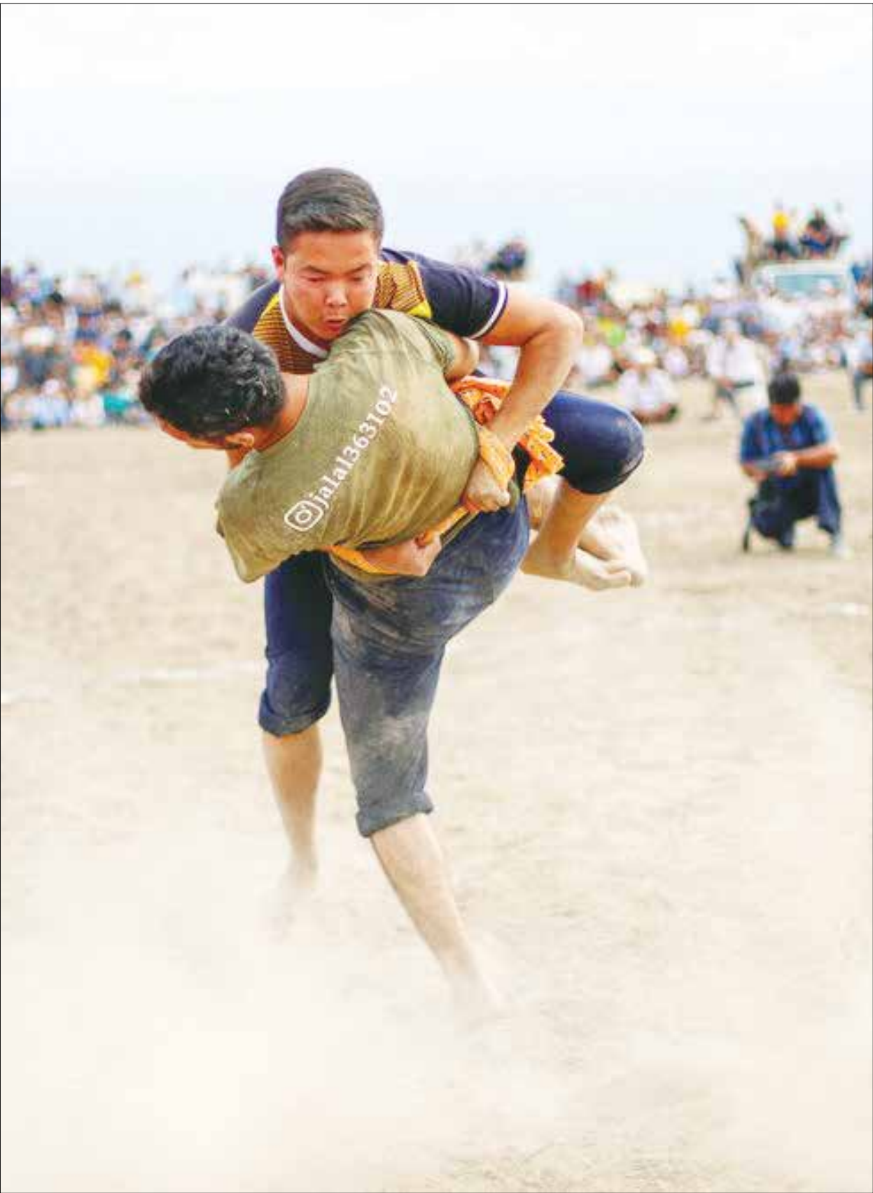
گورش کشتی سنتی ترکمن صحرا